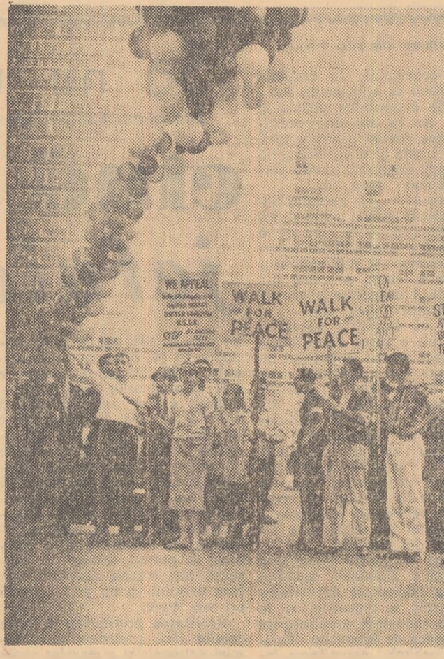
O manifestație a studenților americani împotriva experiențelor cu arma nucleară

Institutul de Cercetări Geologice din Pekin este construit după modelul celui sovietic. El cuprinde studenți din toate țările țării. Marile clădiri și terenurile verzi din jurul lor, constituie un loc minunat pentru studii și odihna celor 5.000 de studenți.