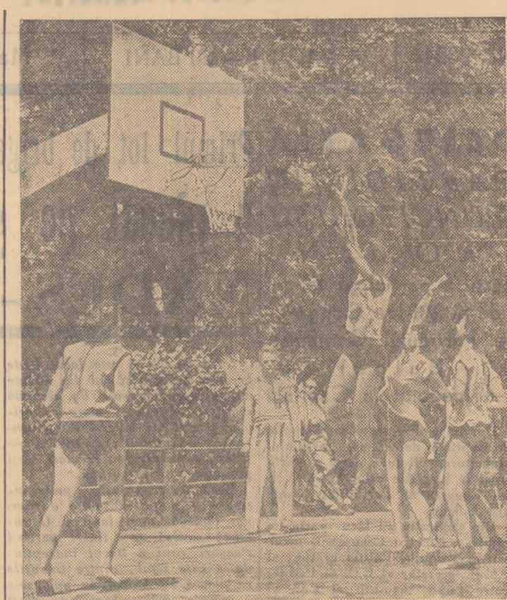
Fază din întâlnirea de baschet a reprezentativilor București și Oradea desfășurată în cadrul întrecerilor „Ceferiadei școlilor profesionale”

Sint aici câteva probleme ivite în desfășurarea Spartachiadei de vară în regiunea Bacău, discutate recent într-o consfătuire a Comisiei Centrale de organizare a Spartachiadei. Ele prezintă pentru numeroase regiuni o valoroasă experiență. Cît privește slăbiciunile scoase la iveală cu acest prilej, acestea pot și trebuie să se rezolve. În cel mai scurt timp. Mai sint aproape două săptămîni pînă la terminarea etapei de masă. Să asigurăm succesul actualii ediții a Spartachiadei de vară a tineretului.