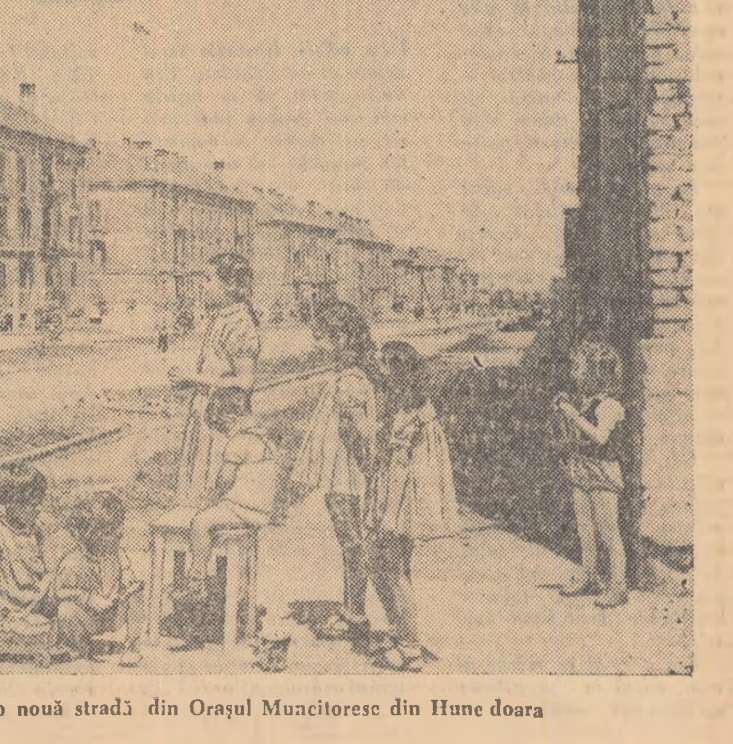
Într-o dimineaţă pe o nouă stradă din Oraşul Muncitoresc din Hunedoara