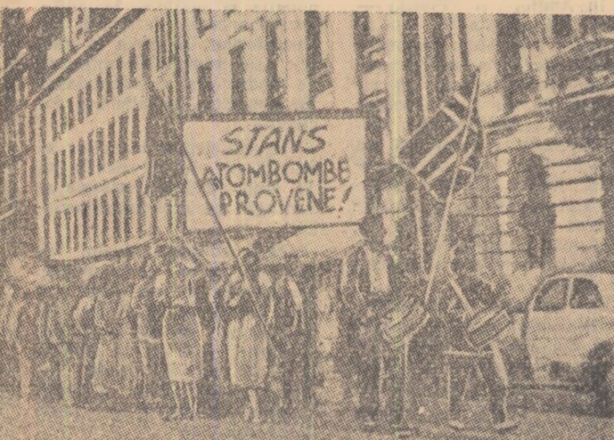
De curând pe străzile capitalei Norvegiei, Oslo, locuitorii s-au strins într-o coloană impresionantă purtând placarde: „Să înceteze experiențele cu bombele nucleare!”

CAIRO 10 (Agerpres). — Departamentul Artelei din Ministerul Orientării Naționale al Republicii Arabe Unite a organizat la 8 iunie în parcul Patatului Republicii din Cairo o seară de cultură românească. Cu acest prilej compozitorul Abdel Halim Nura a vorbit despre muzica și dansurile populare românești. În continuarea a urmat un program de muzică românească și a fost prezentat filmul „Ciochila”. La spectacol au participat Farid Messawy, directorul Departamentului Cinematografiei, funcționari superiori din Ministerul Orientării Naționale, compozitori, oameni de artă, artiști, membri ai clubului „Cinefilm”, precum și membri ai Ambasadei R.P. Române la Cairo.