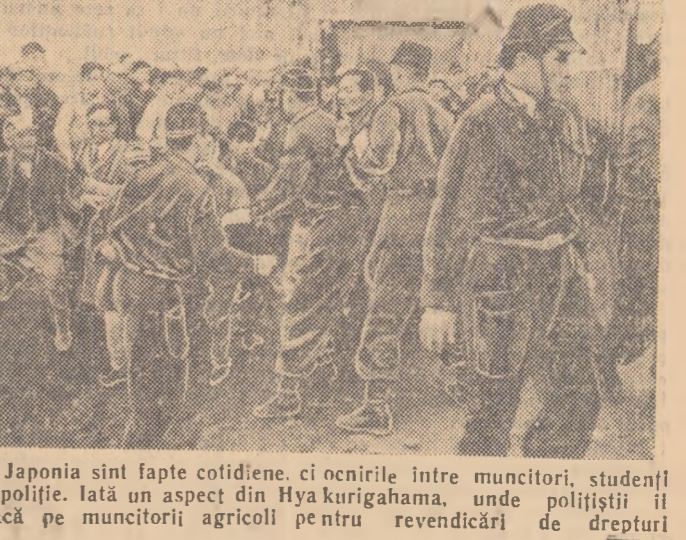
În Japonia sînt fapte cotidiene, ci onirice între muncitori, studenți și poliție. Iată un aspect din Hyakurighama, unde polițiștii îi atacă pe muncitorii agricoli pe ntru revendicări de drepturi

NEW YORK. — La 9 iunie în clădirea de expoziții Coliseum de pe Columbia-Circle s-a deschis cea de-a patra expoziție industrială de automatizare. Pentru prima oară la expoziție participă Uniunea Sovietică.