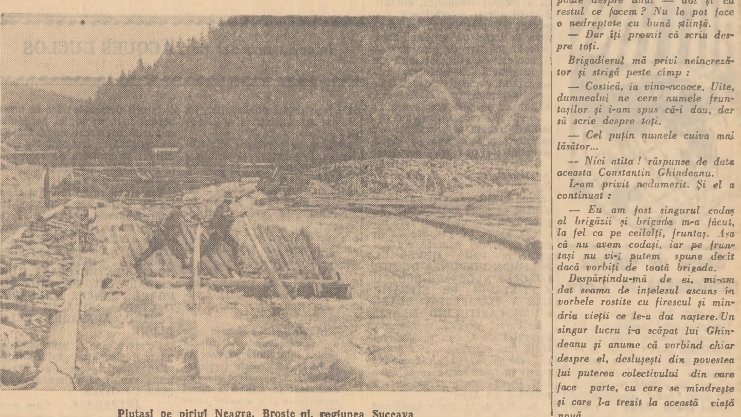
Plutași pe pîrîul Neagra, Broște ni, regiunea Suceava

La 10 iunie s-a jucat runda a II-a a meciului de șah R.P. Română-R.P. Polonă. Rezultatele sînt următoarele: Trojanescu (R.P.R.) — Plater (R.P.P.) 1/2-1/2; Sliwa (R.P.P.) — Ciocîlța (R.P.R.) 0-1; Miștelu (R.P.R.) — Szuksta (R.P.P.) 1/2-1/2; Gromek (R.P.P.) — Ghișescu (R.P.R.) 1/2-1/2; Drimer (R.P.R.) — Branicki (R.P.P.) 1-0; Witkowski (R.P.P.) — Gunsberger (R.P.R.) 0-1; Dodo (R.P.P.) — Pavlov (R.P.R.) 1/2-1/2; Pogonievici (R.P.R.) — Knapik (R.P.P.) 1-0; Konarowska (R.P.P.) — Teodorescu (R.P.R.) 1-0; Partida Szabo (R.P.R.) — Tarnowski (R.P.P.) s-a întrerupt cu un uor avantaj pentru jucătorul român. Rezultatul runde a II-a este de 6-3 pentru R.P.R., iar rezultatul final este de 10 1/2 — la 8 1/2 în favoarea echipei R.P.R. (Agerpres)