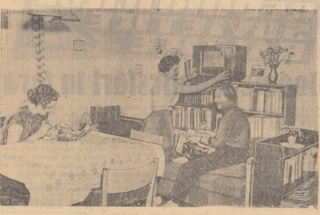
Școala superioară pedagogică din Potsdam are un frumos cămin. În R. D. Germană, studenții ca și întregul tineret se bucură de grija statului