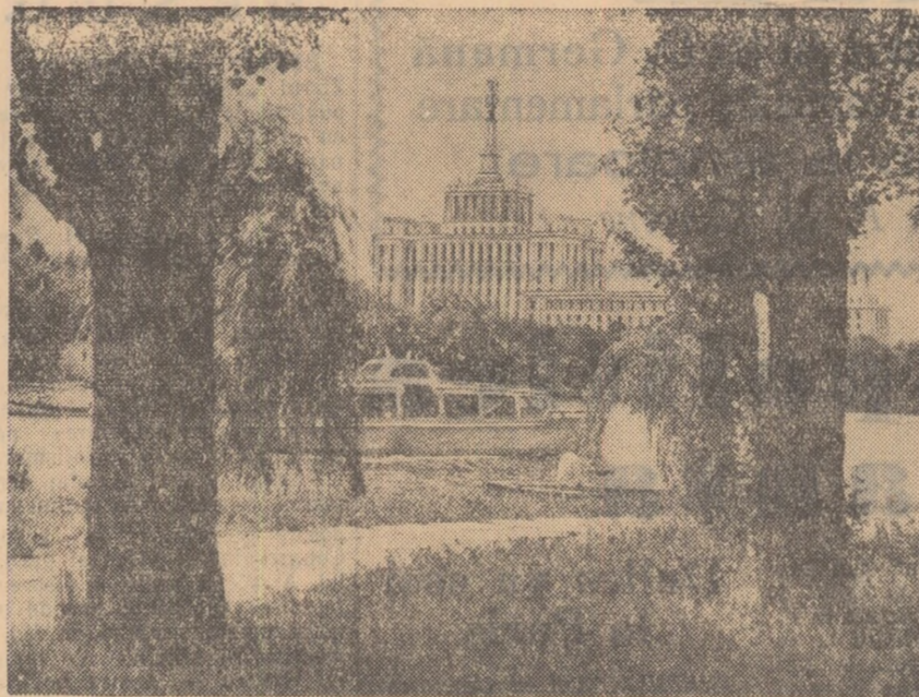
Parcul de Cultură și Odihnă „I. V. Stalin” — vedere spre „Casa Științei”