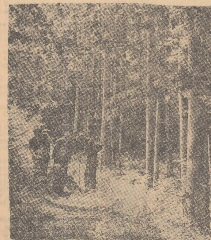
Peste cîteva clipe vor sosi aci și ceilalți elevi din Anina plecați în excursie

Conștienți de faptul că numai printr-o înaltă pregătire de cultură generală și profesională pot deveni buni specialiști, mii de tineri, fii de muncitori și țărani muncitori care au absolvit școlile medii și mii de muncitori mai vîrstnici care au terminat studiile medii se îndreaptă spre facultăți. Este foarte greu să-i poți număra pe toți acei care fie că minusec un strung sau un tractor, fie că lucrează într-o uzină sau pe ogoarele unei gospodării, doresc cu ardoare să învețe, să devină ingineri, agronomi, medici sau profesori. Pe zi ce trece, cererile pe care aceștia le fac la întreprinderi sau la sfaturile populare pentru a fi trimiși la studii superioare ca bursieri sînt tot mai numeroase.