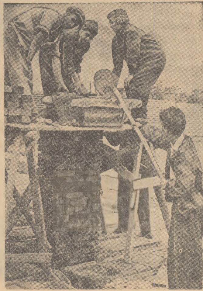
Elevii ploieșteni lucrează la construcția unor blocuri muncitorești