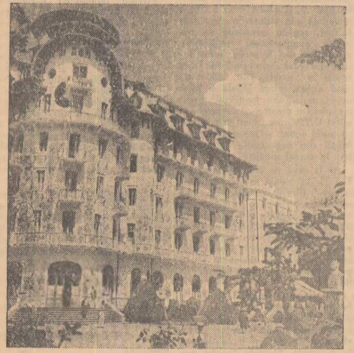
În stațiunea balneo-climaterică Govora