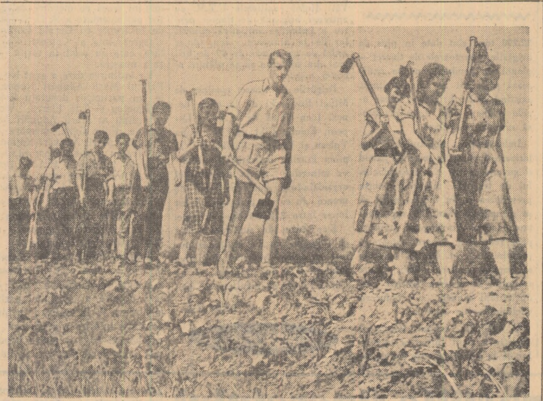
S-a terminat o zi de muncă pe lotul școlii medii mixte maghiare din Deva.