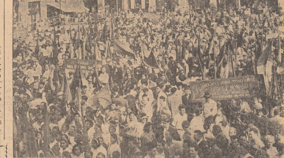
Principala piașă din Ploești în treamătul tinereții

Mitingul a fost în același timp o demonstrație a vieții libere și a