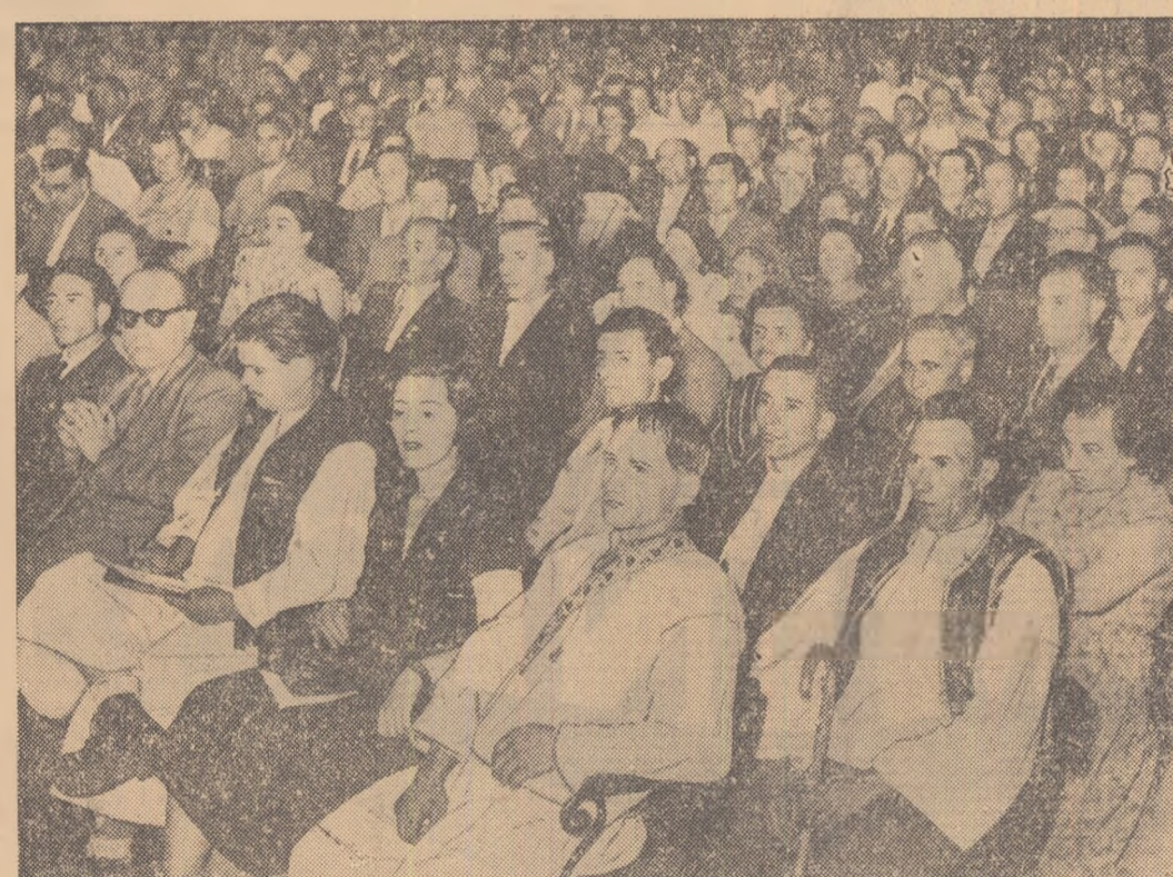
Una spect din sala Conferinței