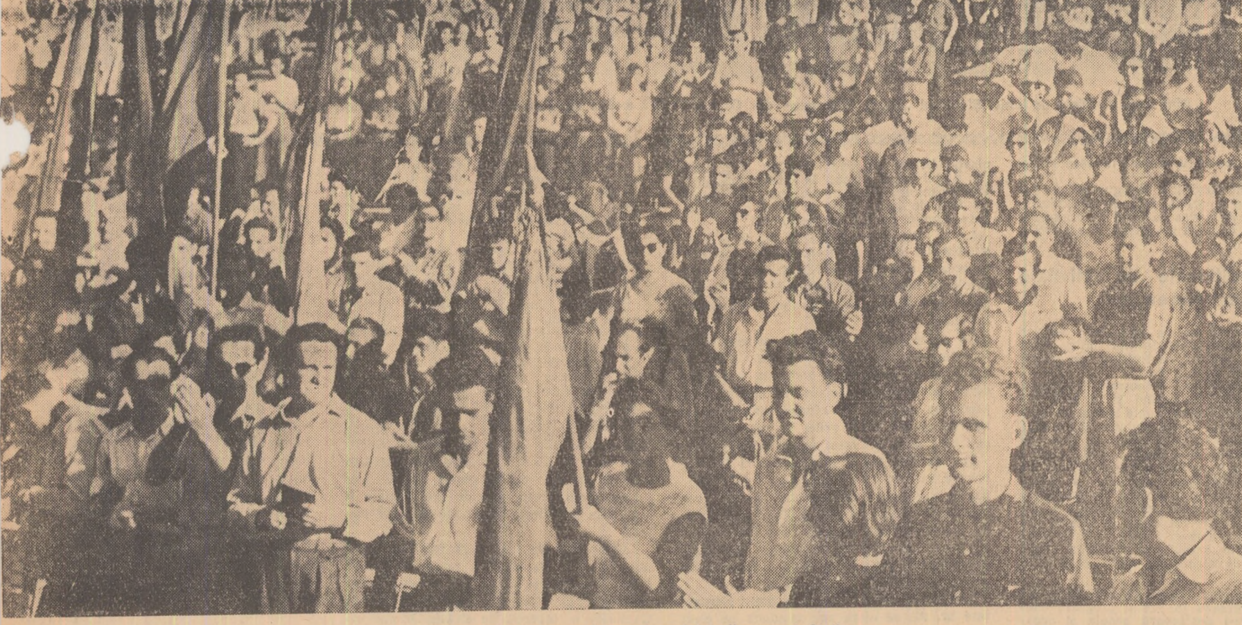
Un aspect de la reuniunea tineretului din parcul Stalin