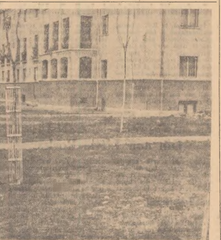
De curînd a fost dat în folosință în Lunca Pomostului un nou bloc pentru metalurgişti.

Organizația de partid de la termo-centrala tineretului din Rorzești îndrumă organizația U.T.M. în vederea educării tineretului în spiritul muncii harnice, patriotice. Am atîns și consolidăm conținutul nostru — acela de a forma un colectiv sudat puternic și unit care să corespundă sarcinilor de seamă pe care partidul ni le pune în față.