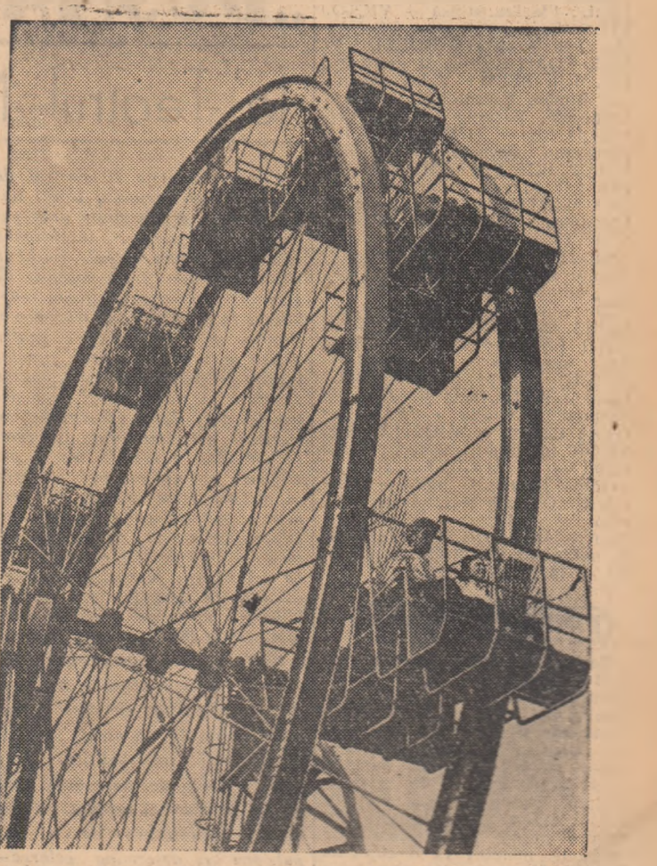
În Parcul de cultură și odihnă „I. V. Stalin” din Capitală

„Trupele sovietice au început să părăsească Republica Populară Romînă. Pretutendiu, în orașele pe unde au trecut în drumul spre patrie ostașii sovietici, poporul romîn și-a luat rămas bun de la ei prin calde manifestații pentru prietenia dintre poporul sovietic și poporul romîn. Și aceasta nu întîmplător. Ostașii sovietici, îndeplinindu-și mi-