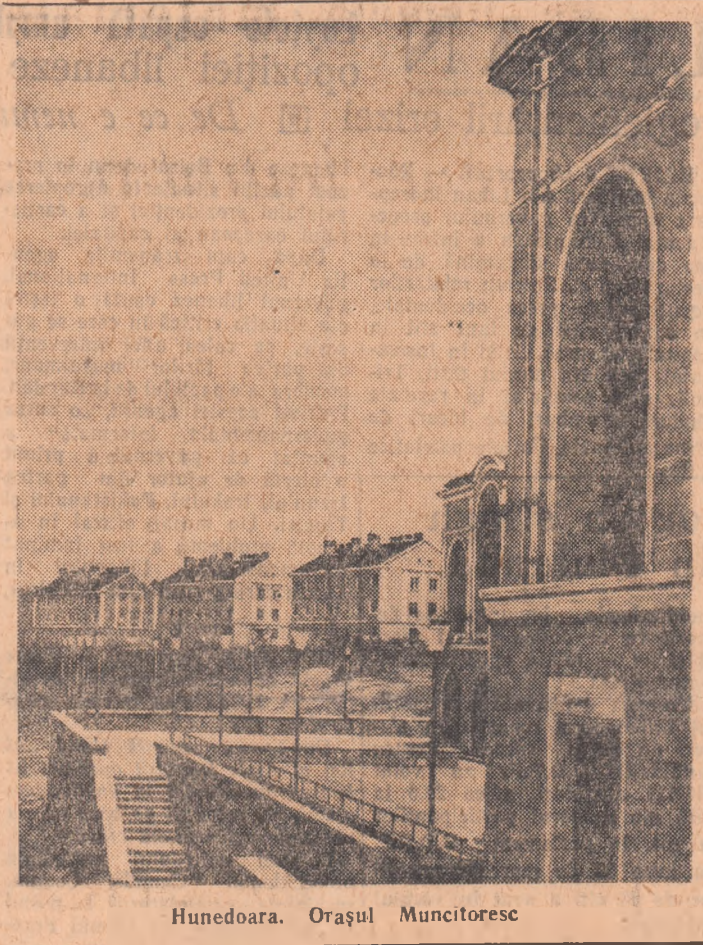
Hunedoara. Orașul Muncitoresc