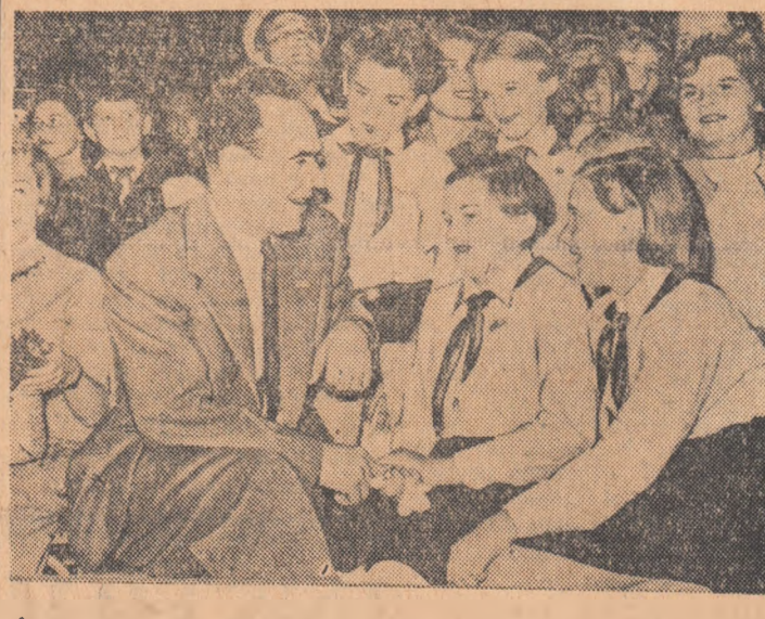
În urmă cu câteva zile a avut loc la Bratislava „Adunarea tineretului de la Dunăre”. Tinerii cehoslovaci au luat parte la competițiile de creație, dansuri și manifestări sportive etc. În foto: Copiii ascultînd amintirile fostului comandant de partizani din Liban”.