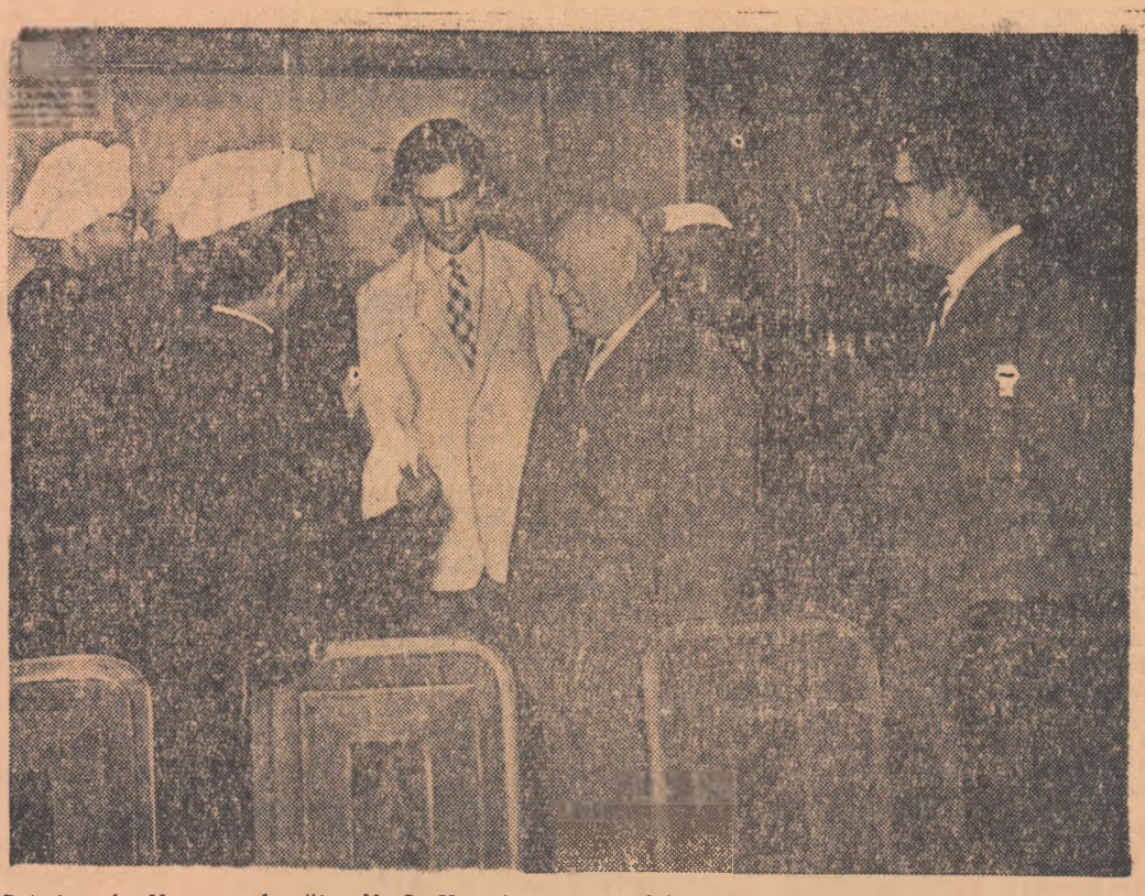
Primirea la Moscova de către N. S. Hrușciov a unei delegații a Congresului Tineretului din Italia

GENEVA 8 (Agerpres). — La 7 iulie conferința experților pentru studierea mijloacelor de delectare a exploziilor nucleare a continuat examinarea problemelor referitoare la metoda acustică de delectare. Delegația sovietică a prezentat spre examinare conferinței un proiect de hotărîre cu privire la posibilitatea de a se aplica în acest scop procedeele de înregistrare a undelor aeriene. Delegația occidentală a prezentat o specificație a principalelor factori care urmează să fie examinați pentru a se putea soluționa problema aplicabilității metodei acustice. Urzătoarea ședință a experților are loc la 8 iulie.