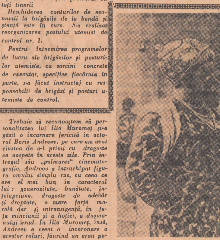
O imagine din filmul „Călătorie peste trei mări”

Pentru următoarele trei zile în afară de vreme caldă și cu cer schimbător, mai mult senin, mai ales noaptea și dimineața. Averse izolate vor cădea la începutul intervalului mai ales în nord-estul țării. Vînt slab, plin la potrivit. Temperatura în creștere; minimele vor oscila între 10 și 22 grade, iar maximele între 22 și 34 grade.