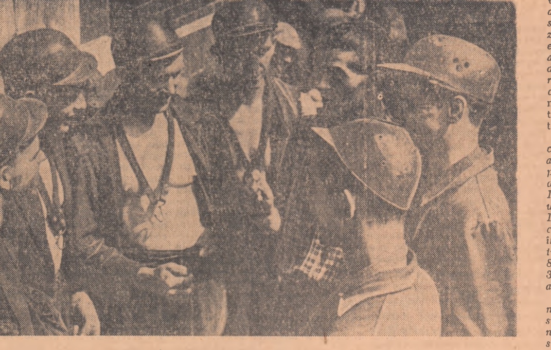
Brigada „Macarenko” înainte de intrarea în șut