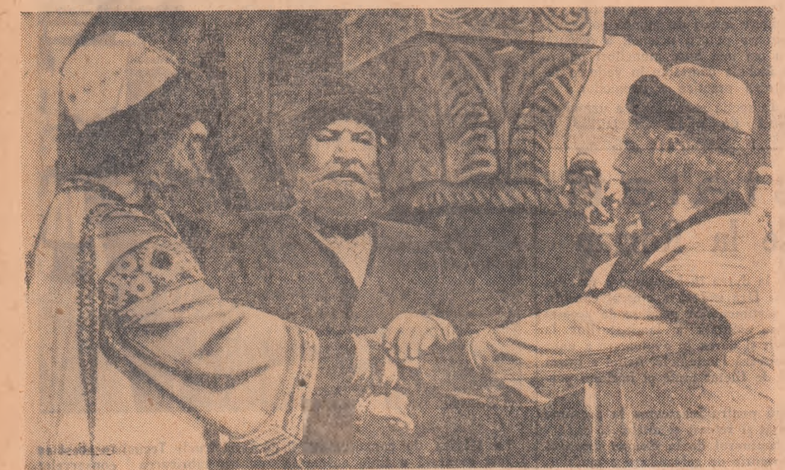
Scenă din filmul „Balada voinicului”