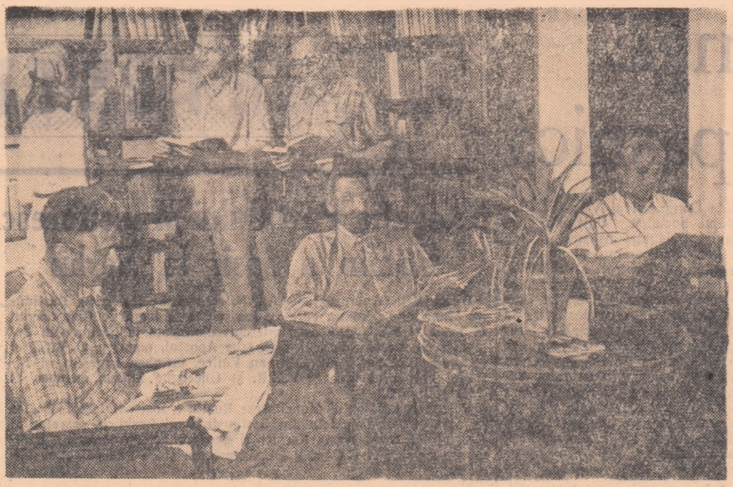
Aspect din biblioteca Casei de cultură „M. Sadoveanu” din Băile Govora