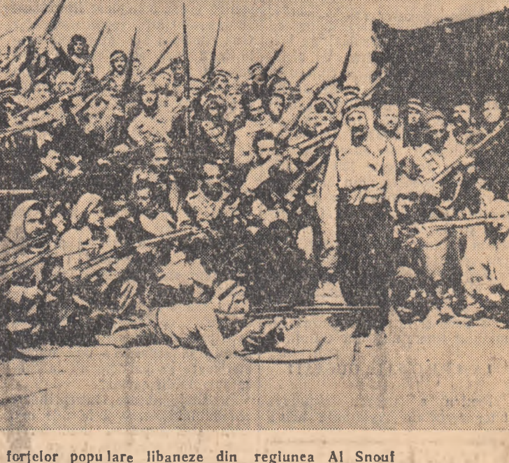
Un detașament al forțelor populare libaneze din regiunea Al Snuif

Într-un interviu acordat presei siriene, liderul opoziției libaneze Ahmed el Assad a declarat că în cursul luptelor din Liban au fost ucise 10.000 de persoane din rîndul trupelor guvernamentale și ale războiului.