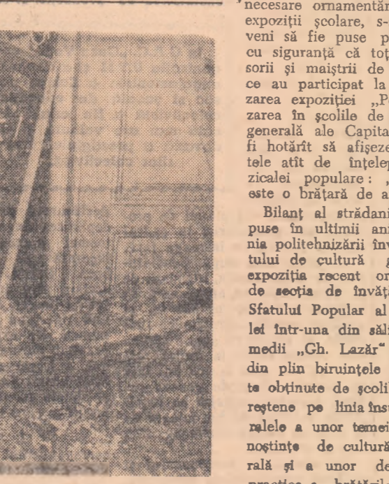
Impresionează din primul moment bogăția exponatelor electrotehnice, mecanice, chimice, chiar agricole. În standuri speciale, o gamă nesfîrșită de exponate începînd de la simple ciocane și echeri reglabile pînă la complicate fierășteri și machete de hidrocentrală, denotă o intensă activitate în cadrul orelor practice, înțelegerea unor probleme tehnice, însușirea unor deprinderi tehnice specifice unei înalte calificări.

Unul din scopurile de seamă ale educației patriotice este acela de a-l face pe fiecare elev să înțeleagă că manifestarea dragostei față de patrie se exprimă prin fapte, prin efortul pe care îl depune în a contribui la muncă constructivă care se desfășoară în patria noastră. Anul acesta, însușeștii de asemenea sentimente de patriotism elevii au cerut să participe la muncile de folos patriotic la