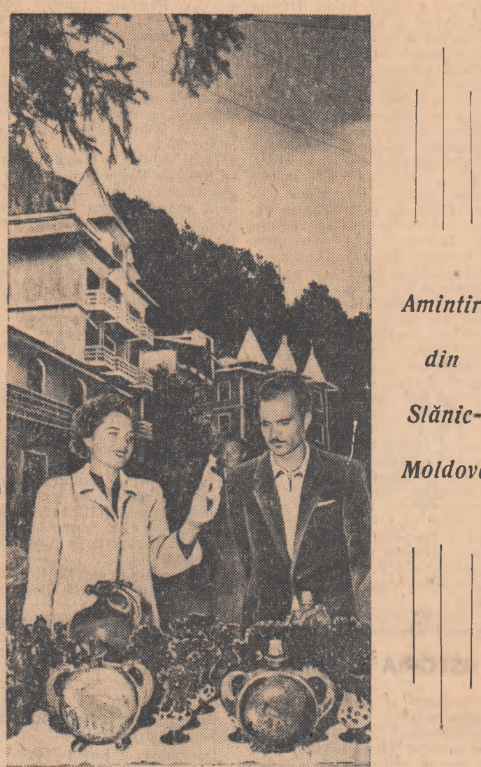
Amintiri din Slănic- Moldova