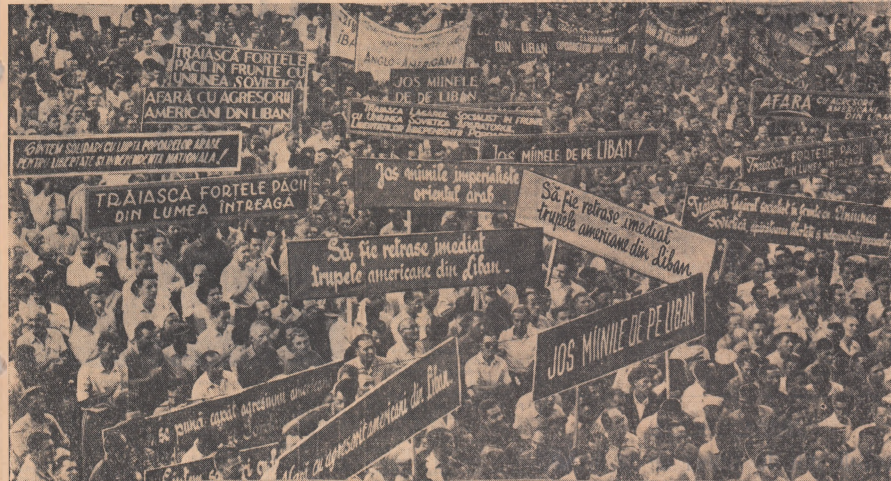
Piața Universității în timpul mitingului

Oamenii muncii din întreaga țară înfiează agresiunea colonialistă împotriva Orientului arab