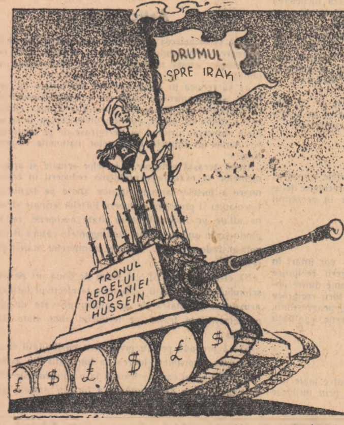
(desen din PRAVDA)

NEW YORK 20 (Agerpres). — După cum transmite correspondentul din Amman al agenției Associated Press, la 20 iulie autoritățile iordaniene au rupt legăturile dip- lomate cu Republica Arabă Unită.