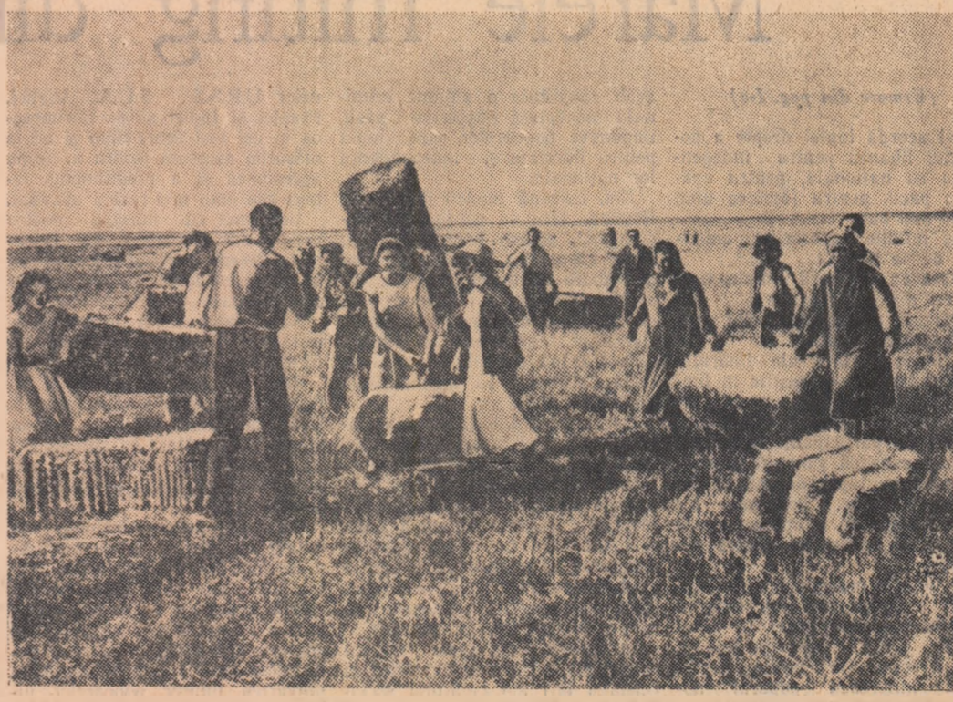
Peste 200 de tineri muncitori din cîteva întreprinderi din orașul Constanța au mers împreună la gospodăria agricolă de stat din Dobroanța de unde vă prezentăm o imagine fotografică. Tinerii de la oraș adună de pe miriște baloturile de paie în urma preselor de îmbalotat. În felul acesta terenul rămîne liber pentru arăturile de vară.