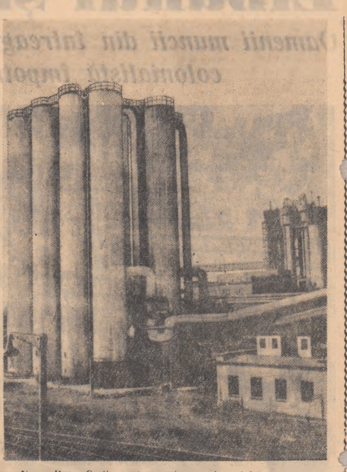
Nowa Huta. Secția pentru producerea benzolului

La 22 iulie, poporul frate polonez sărbătorește pentru a 14-a oară ziua eliberării de sub jugul fascist. În vara anului 1944 glorioasele armate sovietice, zdrobind fără crutare bătăliile lui Hitler, au trecut la eliberarea Poloniei. Alături de soldații sovietici, unitățile armatei poloneze reînscute și-au vărsat sîngele pentru alungarea fiarei fasciste. Înaintea de eliberare, Polonia burghezo-mosierăscă era din toate punctele de vedere la remorca puterii imperialiste, conducătorii ei promovînd o politică fascistă, naționalist-șovină, antisovietică. Legată prin mii de fire și înfăudată de către capitalul străin țara se zbatea într-o cruntă inapoiere economică. Polonia dinaintea de eliberare de sub jugul fascist era o semicolonie a marilor puteri imperialiste. Polonia de azi se deosebește de cea de la război de Polonia burghezo-mosierăscă. Sub conducerea Partidului Muncitoresc Unit Polonez, clasa muncitoare din Polonia, în alianță cu lărmimea și strîngînd în jur toate forțele patriotice și democratice ale țării, a reușit în scurtă vreme să ridice țara din ruina și scrumul lăsată de ultimul război mondial. Poporul polonez și-a ales un nou drum de dezvoltare istorică — drumul construirii socialismului.