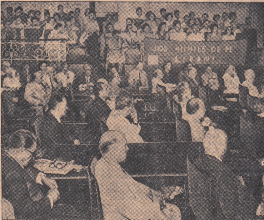
Un aspect de la mitingul de la Academia R. P. Romine