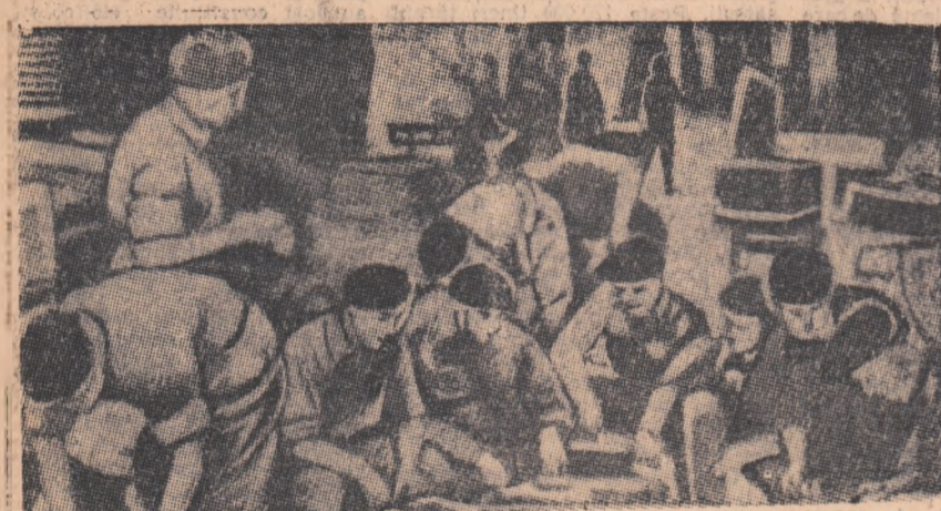
Insula Cipru a devenit un arsenal și o bază a trupelor colonialiste engleze. În fotografie putem vedea parașutiști, pregătindu-se în vederea lansării în țările care în prezent sînt victime ale agresiunii imperialiste.

ISTANBUL 22 (Agerpres). — Ziarul „Yeni Gazete” anunță concentrări de trupe la frontierele sudice ale Turciei. Ziarul „Cumhuriyet” scrie că pe aeroportul din Ankara aterizează cu regularitate avioane de transport americane care după ce se alimentează cu combustibil decolează spre est.