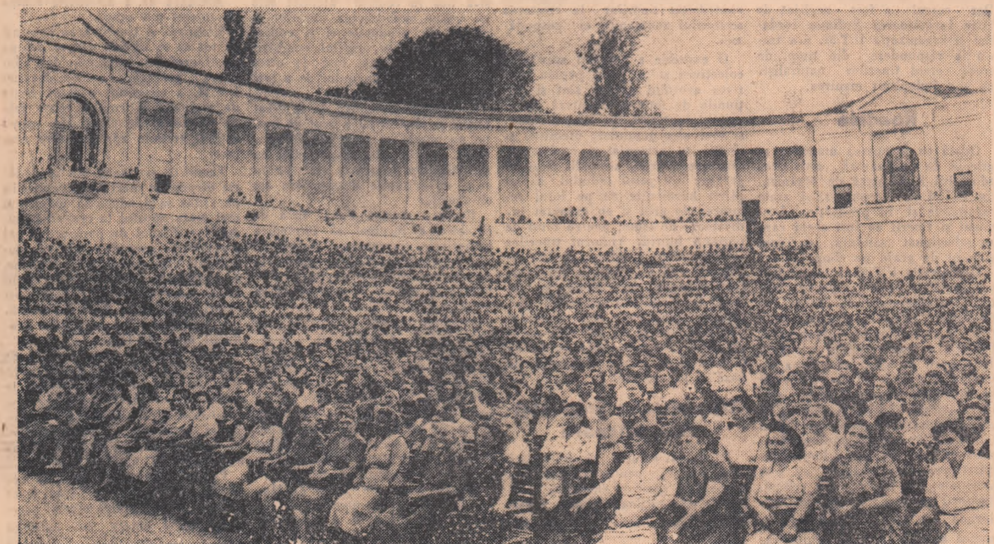
La mitingul de la „Arenele Libertății”