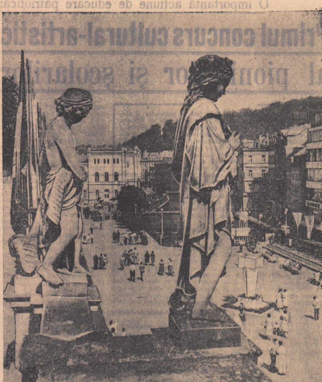
Un aspect de la Karlovy Vary unde se ține festivalul internațional al filmului 1958