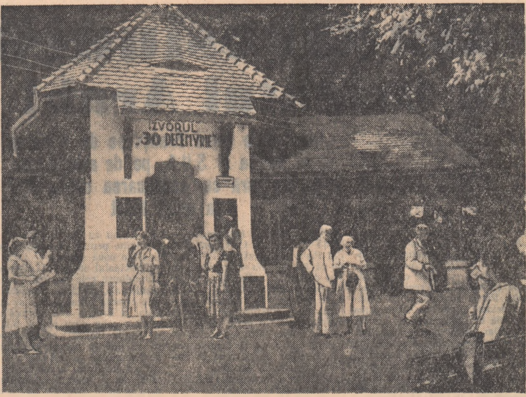
Izvorul „30 Decembrie” Govora — este mult căutat de oamenii muncii veniți aici la cură și odihnă