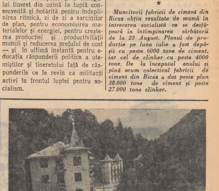
Vacanță studențească în pitoresca stațiune Sliac Moldova