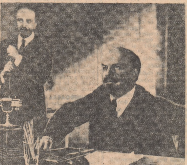
Scenă din filmul „Comunistii” — o valoroasă realizare a cineaștilor sovietici care va rula în curînd pe ecranele noastre