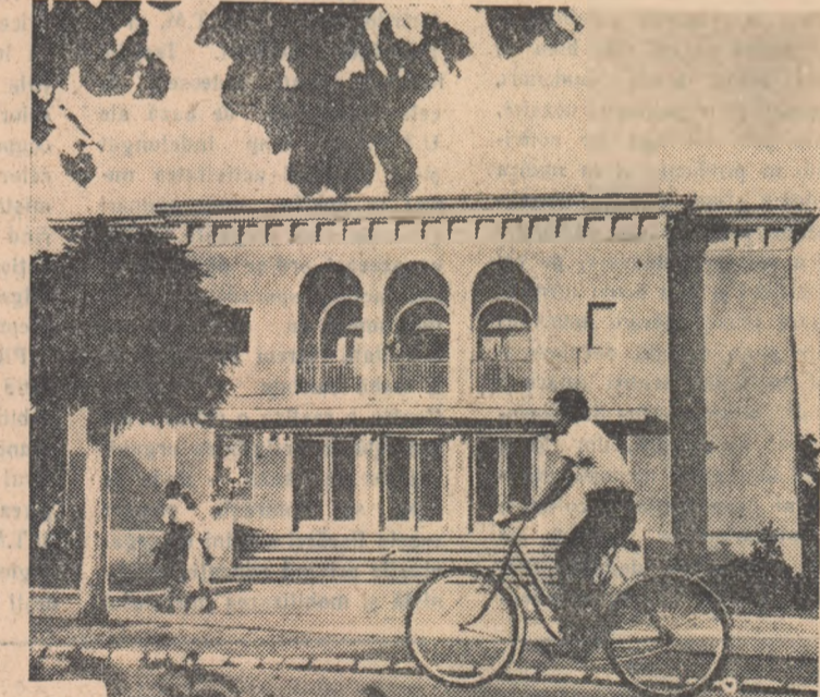
Pentru mineri s-a construit în anul regimului democrat-popular și cinematograful „7 Noiembrie” din Petroșani.

la minte, mai harnic și mai priceful. A ajuns repede ajutor de minier. A primit un apartament în blocurile noi de la Lonea, și-a adus nevasta, soacra și s-a statornicit în Valea Jiului.