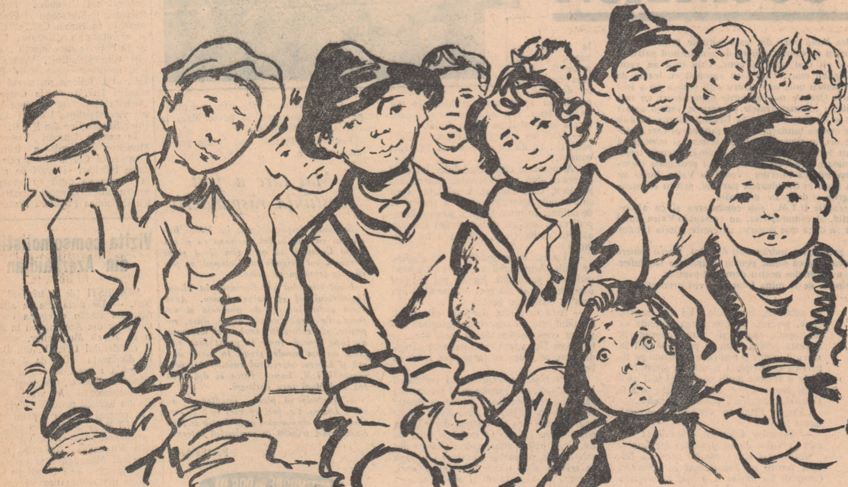
Teatrul de papuși în turneu în sat

De curînd Ministerul Învățămîntului și Culturii a luat o serie de măsuri menite să stăvilească aceste practici dăunătoare. Oricum spectacole lsau turnee artistice