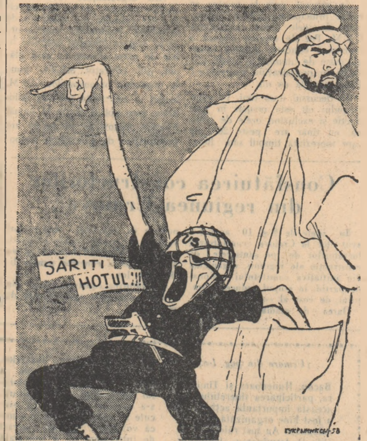
SARIȚI HOTUL! (Desen din „Pravda”)

Din partea U.R.S.S. au fost de față K. E. Vorosilov, președintele Prezidiului Sovietului Suprem al U.R.S.S. și persoanele care îl însoțesc.