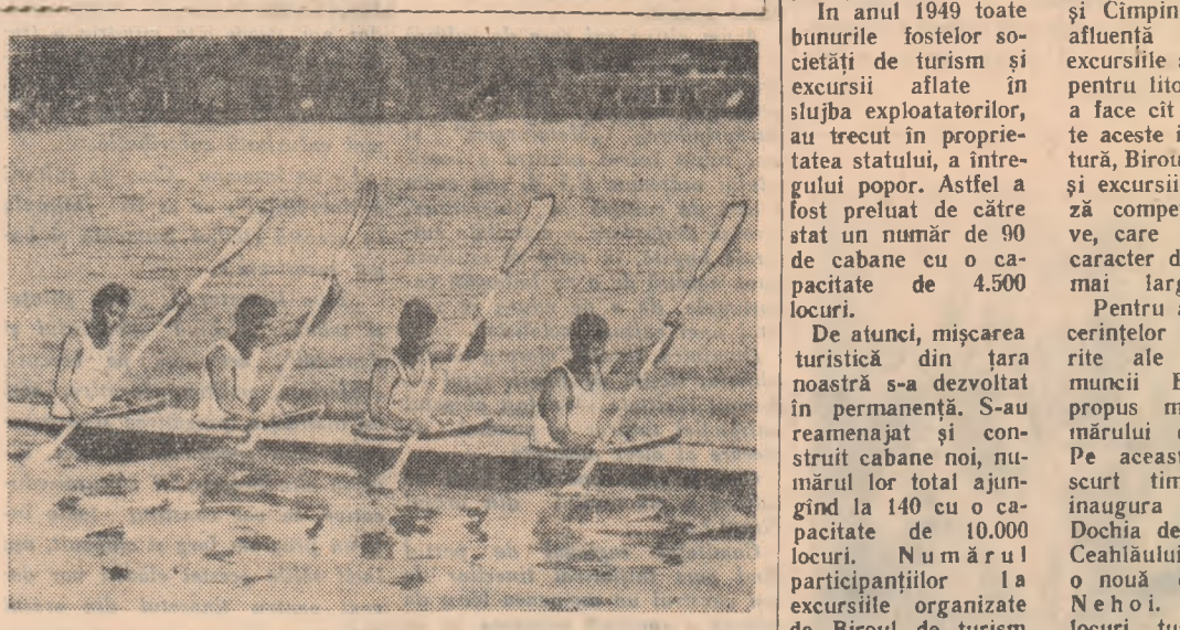
Echipajul asociației „Tinărul Dinamovist” câștigătorul probei de canoă 4 persoane la 1000 m, după câștigarea probei.

La început s'au desfășurat participanțele la finale pe țară care