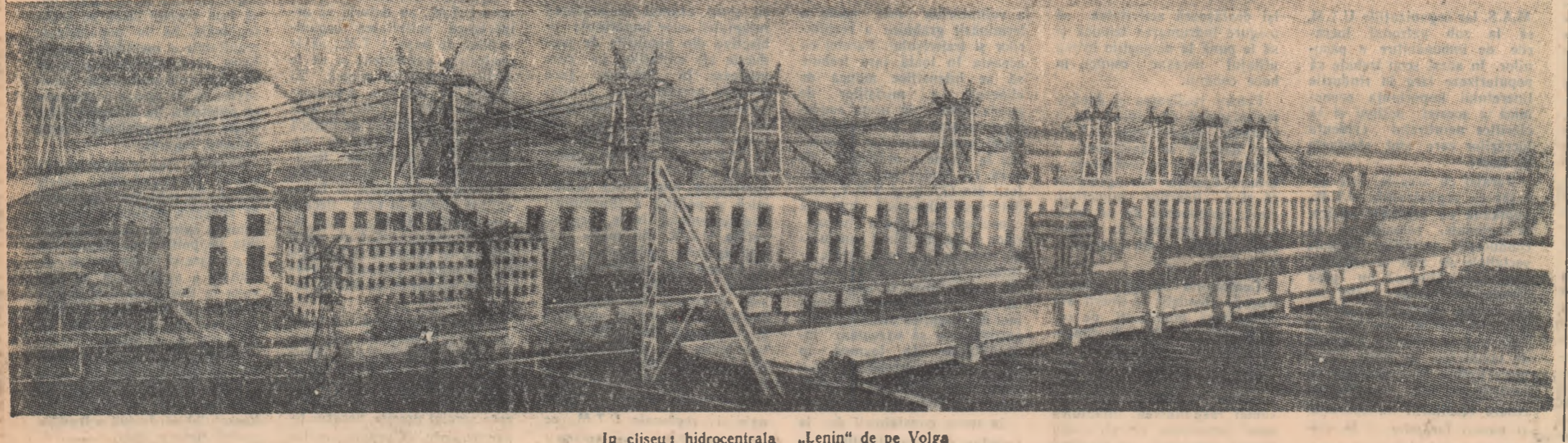
La cișeu a hidrocentralei „Lenin” de pe Volga

CAIRO 11 (Agerpres). — După cum anunță agenția China Nouă, împotriva concentrării de trupe Imamul Omanului a adresat președintelui Consiliului de Miniștri al U.R.S.S., președintelui S.U.A., președintelui Nasser, premierului Nehru precum și secretarului general al O.N.U. Dag Hammarskjöld note prin care protestează împotriva concentrării de trupe britanice la frontiera Omanului. În ședința Consiliului de Miniștri al U.R.S.S., președintelui S.U.A., președintelui Nasser, premierului Nehru precum și secretarului general al O.N.U. Dag Hammarskjöld note prin care protestează împotriva concentrării de trupe britanice la frontiera Omanului. În ședința Consiliului de Miniștri al U.R.S.S., președintelui S.U.A., președintelui Nasser, premierului Nehru precum și secretarului general al O.N.U. Dag Hammarskjöld note prin care protestează împotriva concentrării de trupe britanice la frontiera Omanului.