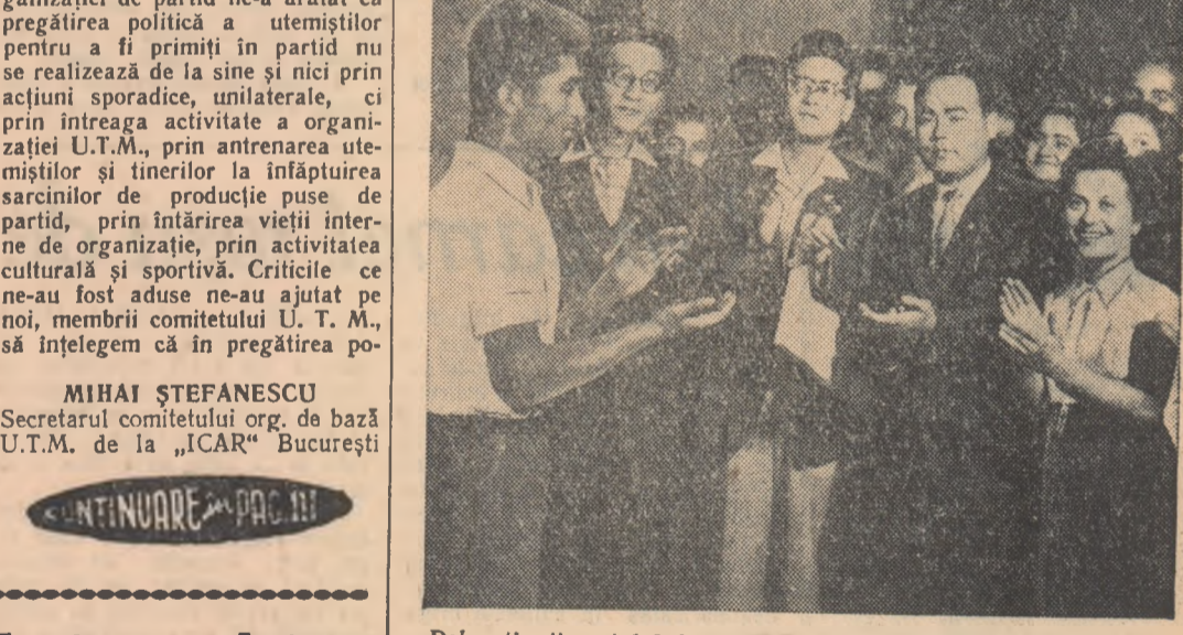
Delegația tineretului japonez în mijlocul tinerilor din Capitală

Convorbirea s-a desfășurat într-o atmosferă cordială.