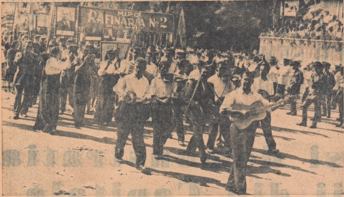
Un aspect de la demonstrația oa menilor muncii din Ploesti.