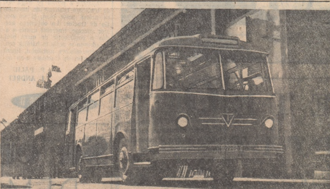
Recent, colectivul de muncă de la uzinele „Tudor Vladimirescu” din Capitală a terminat prototipul noului autobus urban „T.V.-2”. În fotografie puteți vedea eleganța construcției noului autobus românesc.