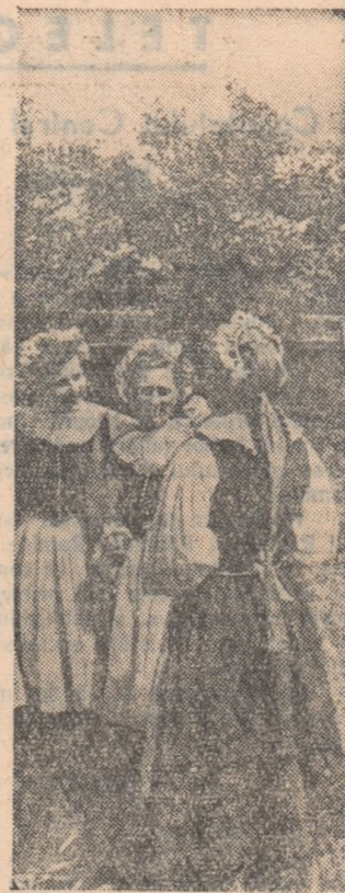
Costumele noastre naționale sînt mult apreciate pentru frumusețea lor. Fotoreporterul a surprins un grup de tineri din Regiunea Autonomă Maghiară îmbrăcate specific locului

Educația comunistă a utemiștilor și tineretului, grija pentru pregătirea lor politică, revine în primul rând organizației noastre de tineret. Cunoșcând toate acestea pe viitor vom căuta să muncim în așa fel încât, lichidând lipsurile de pină acum, să creștem utemiști bine pregătiți din punct de vedere politic, cadre devotate partidului nostru unit.