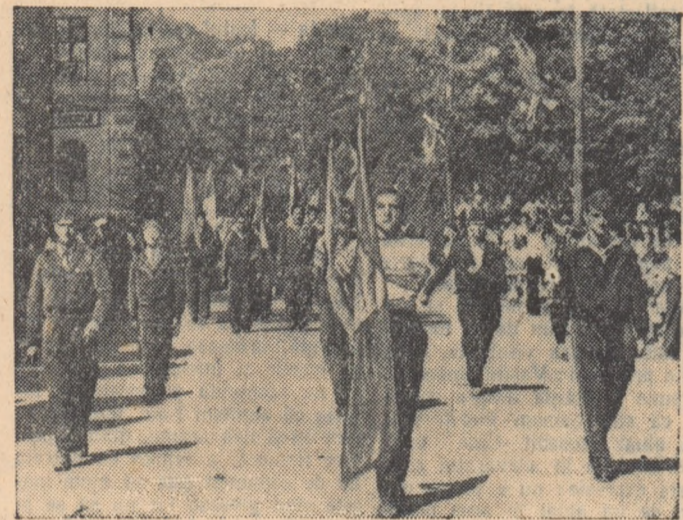
Pe fețele tinerelor în frumosul port românesc se citește bucuria vieții noi pe care o trăiesc.

Oaspeții au fost salutați apoi de Isabelle Blume, vicepreședinte al Consiliului Mondial al Păcii, și Shigeo Sato, secretar al Consiliului Mondial al Păcii, care ne vizitează țara la invitația Comitetului național pentru apărarea păcii din R.P. Română.