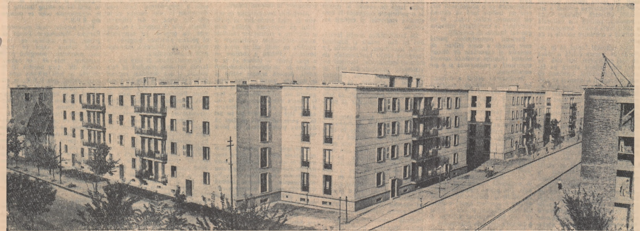
Un coș din noul cartier Floreasca — București