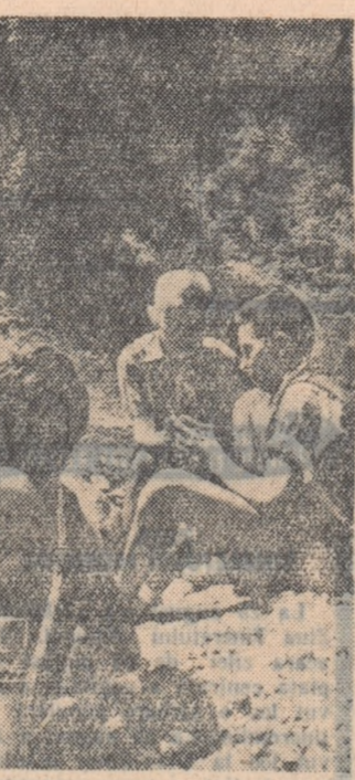
In cauzarea celor mai diferite roci pentru colțul de științe naturale

În cauzarea celor mai diferite roci pentru colțul de științe naturale