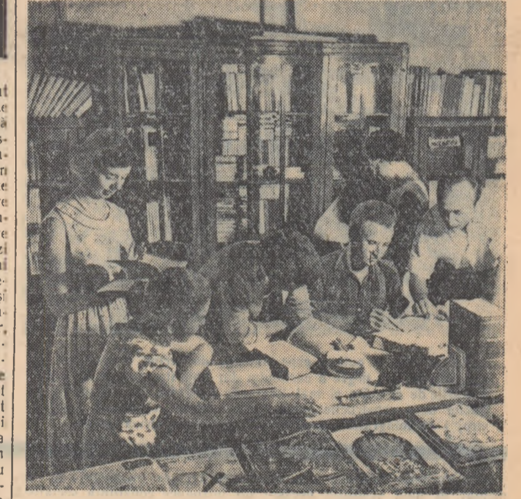
La biblioteca clubului „16 Februarie” al petroliștilor ploșteni