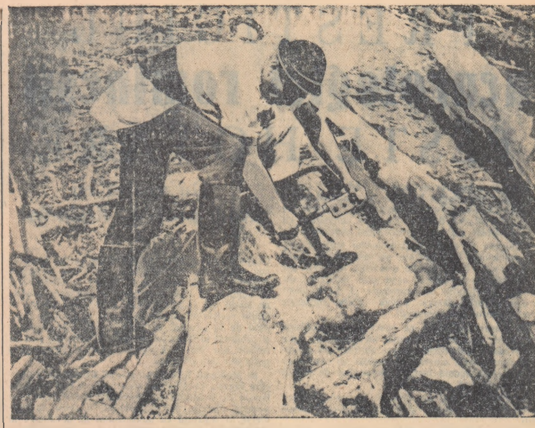
Participanții la consfățuirea de la Reghin au făcut un rodnic schimb de experiență în munți, la gurile de exploatare. Cu acest prilej, tinerii muncitori forestieri din Regiunea Autonomă Maghiară și-au dovedit înalta calificare. În fotografie, un muncitor forestier în plin lucru.

Centrele și președinții pentru examenele de maturitate și de stat din sesiunea septembrie 1958