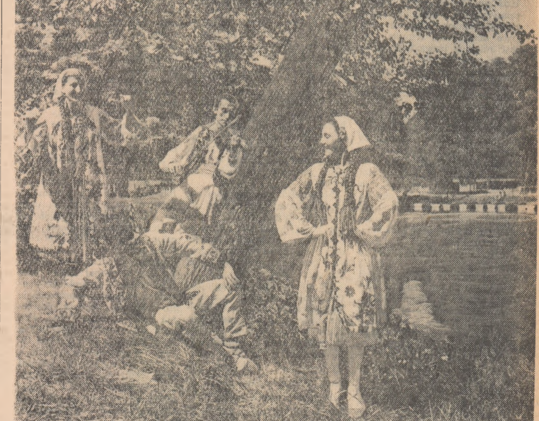
Cîlpe de odihnă