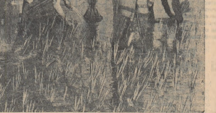
Tinere din naționalitatea tai, membre ale cooperativei agricole din Manchou (R. P. Chineză) juclind la transplantarea orezului

PARIS 5 (Agerpres). — Ziarul „L'Humanité” a publicat chemarea adresată din însărcinarea C.C. de Maurice Thorez, secretarul general al C.C. al P.C. Francez, tineretului Francei, în legătură cu referendumul din 28 septembrie în problema reformei constituției. După ce vorbește despre caracterul reacționar al reformei constituționale în pregătire și despre pericolul instaurării fascismului în Franța, Thorez declară că în fața acestor primejdii Partidul Comunist Francez cheamă tineretul „la protest și la luptă”. „Tineri, uniți-vă, se spune în chemare, pentru a contribui la răsturnarea puterii personale și la restaurarea instituțiilor republicane”.