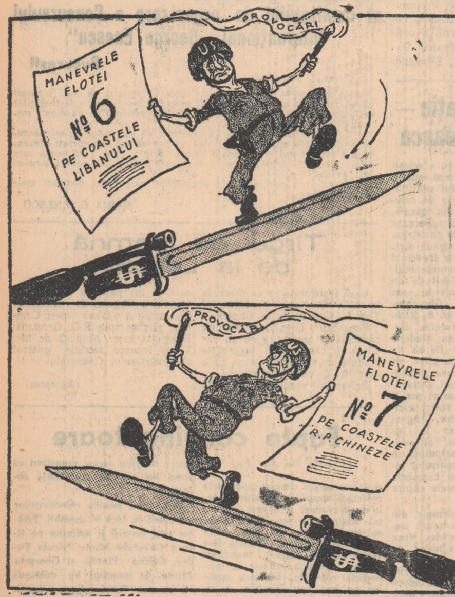
Următorul număr de echilibristică pe marginea războiului