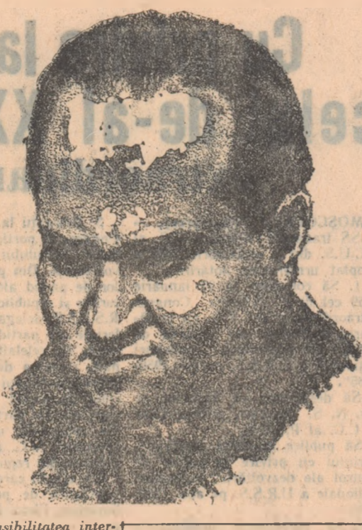
David Oistrach în timpul unui concert.