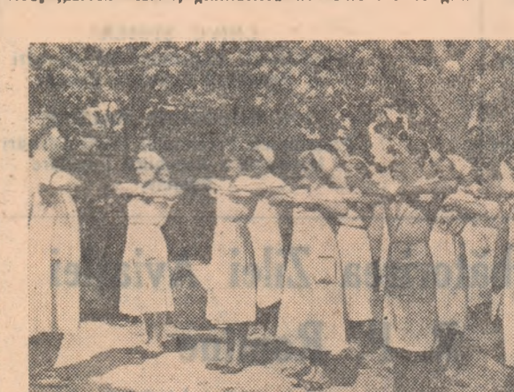
In fotografie un grup de tineri din cooperativa „Unirea Cofetarii” unitatea nr. 1, făcînd gimnastică.