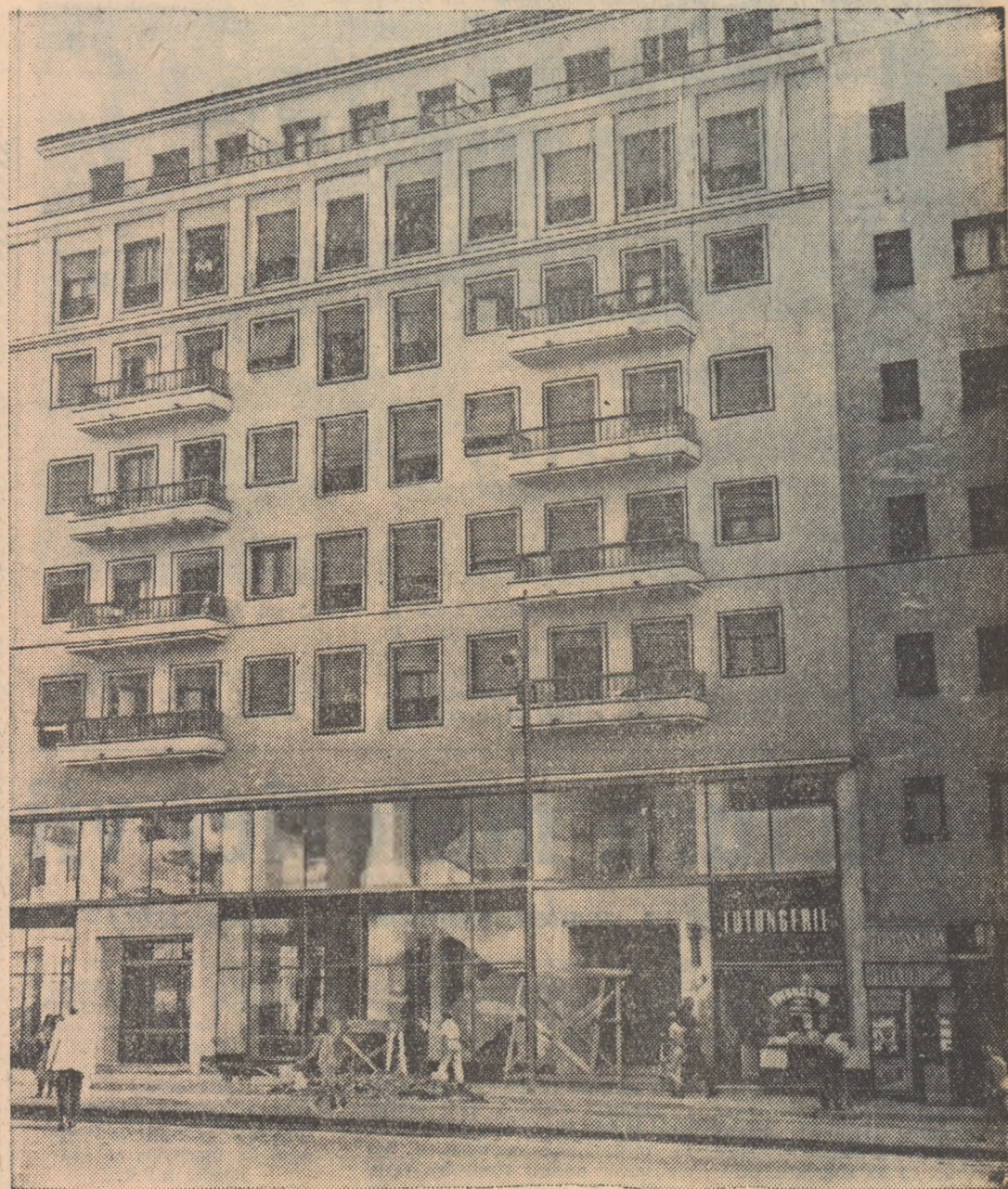
Blocul supraetajat din B-dul 1848 (Plaja de Flori)