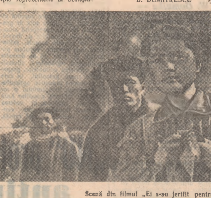
Scenă din filmul „Ei s-au jertfit pentru patrie”

torul Pac Ghien Von după scenariul lui Se Man Ir relatează o întâmplare din anii dinaintea celui de al doilea război mondial, un aspect din suferințele poporului coreean sub ocupația japoneză. Misionarul Stevenson care poartă în prieten și apărător al populației coreene, nu este în fapt decît un tipic reprezentant al bestialu-