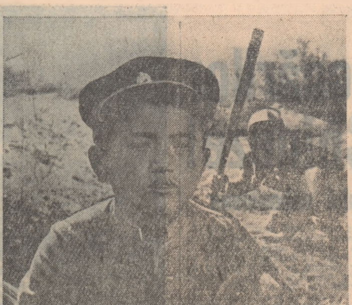
Scenă din filmul „Lupii”

Fotbaliștii romîni au plecat în R.D. Germană Joi dimineața a părăsit Capitala plecînd în R.D. Germană echipa selecționată de fotbal a R.P. Romine care va întîlni la 14 septembrie la Leipzig echipa reprezentativă a R.D. Germane. Lotul echipei noastre este alcătuit din Toma, Voinescu, Zavoda II, Pănaș II, Neacșu, Bone, Petschowski, (Agerpres)