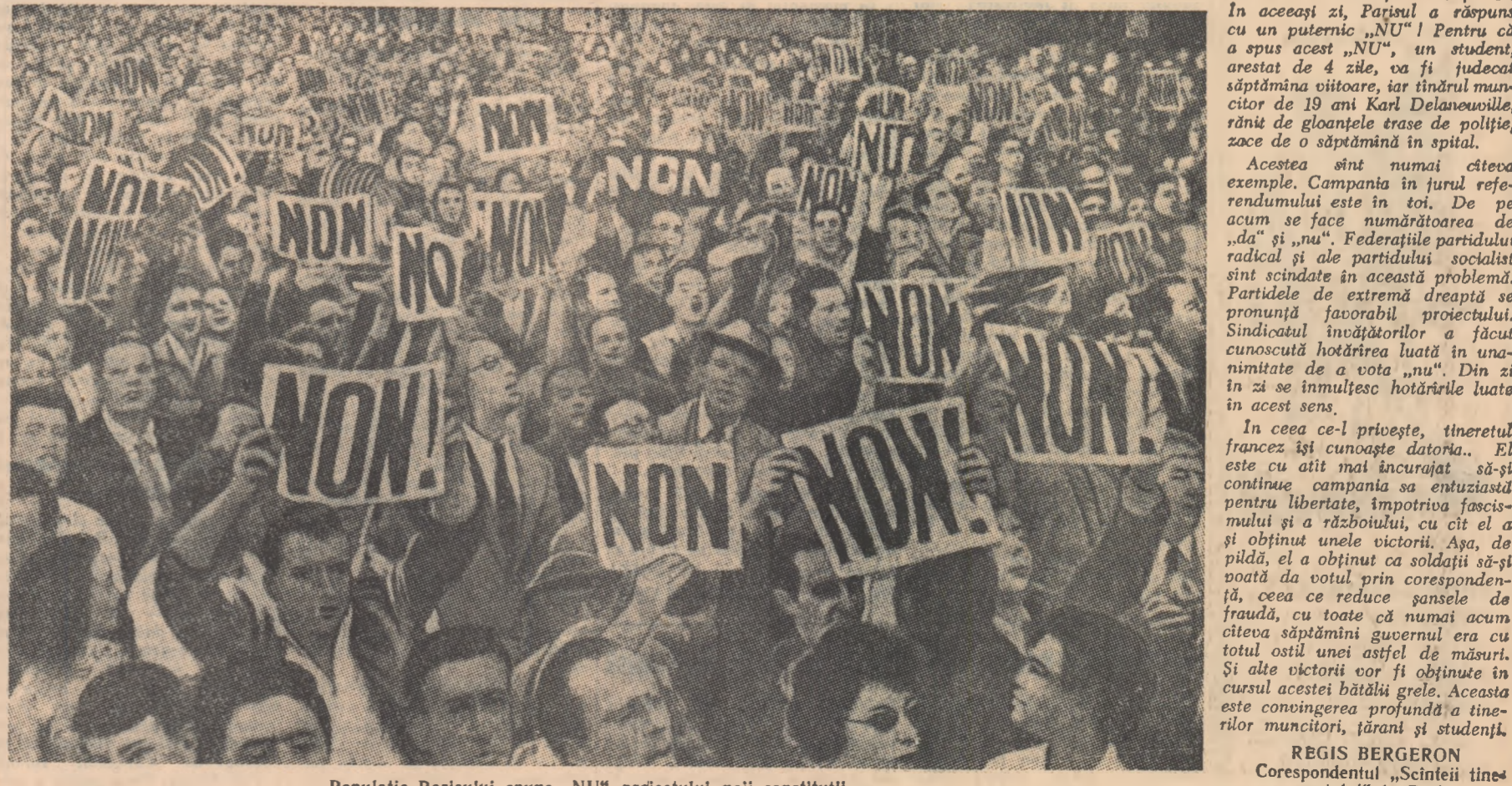
Populația Parisului spune „NU” proiectului noii constituții

L. I. Brejnev, N. S. Hrușciov, A. I. Kiricenko și F. R. Kozlov, au vizitat la 11 septembrie șantierul hidrocentralului de la Stalingrad. Ei s-au interesat îndeaproape de desfășurarea lucrărilor de construcție.