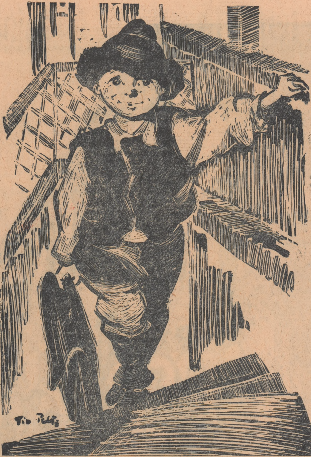
Desen de TIA PELTZ