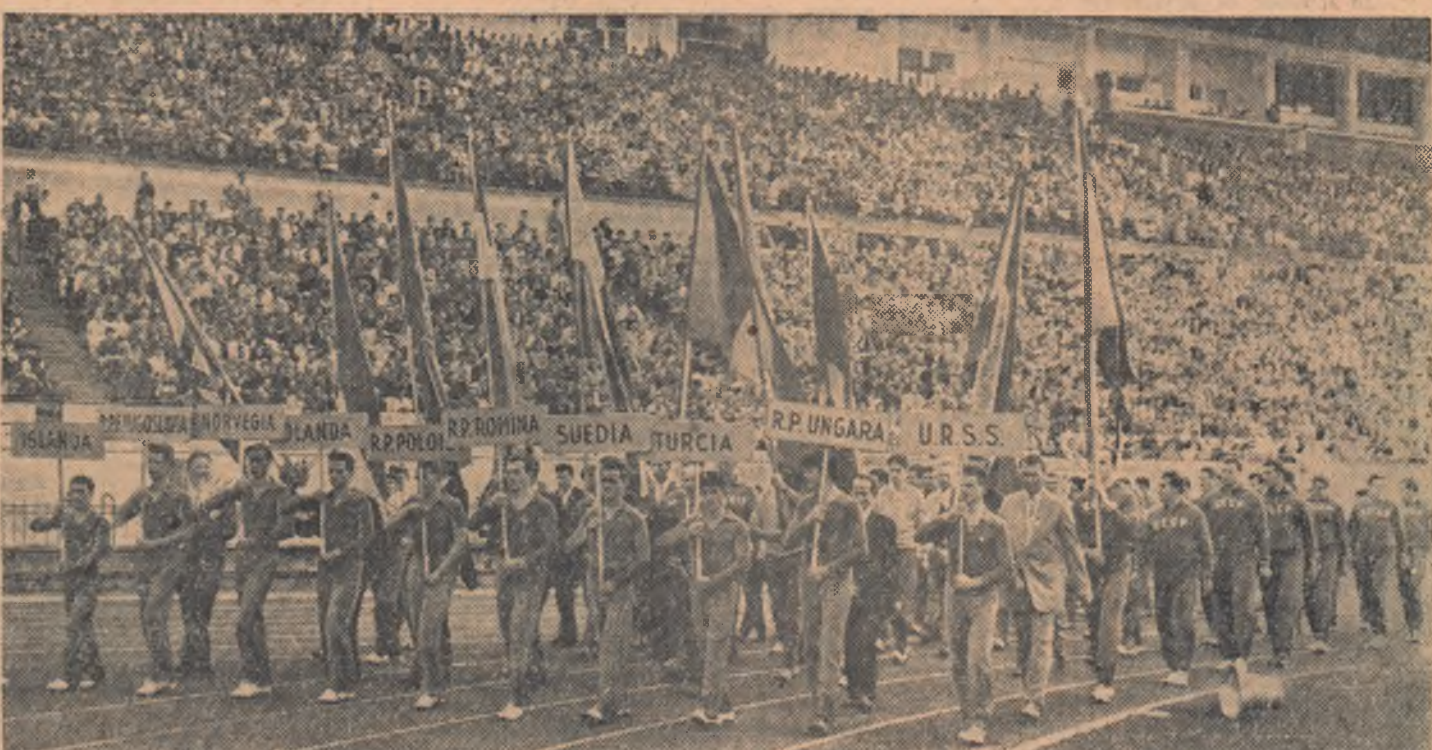
Un aspect de la deschiderea festivă

„Scînteia Tineretului” (Continuare în pag. 2-a)