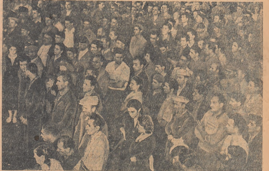
La mitingul muncitorilor de la uzinele „23 August” din Capitală