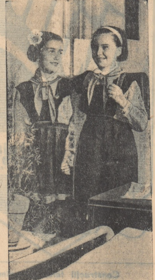
Viața de internat e plăcută și veselă, iar prietenii se leagă aici mai trainic. O spune și aerul fericit de pe fețele acestor fete de la internatul Școlii medii „Zola Kosmodemianskaia” din București.