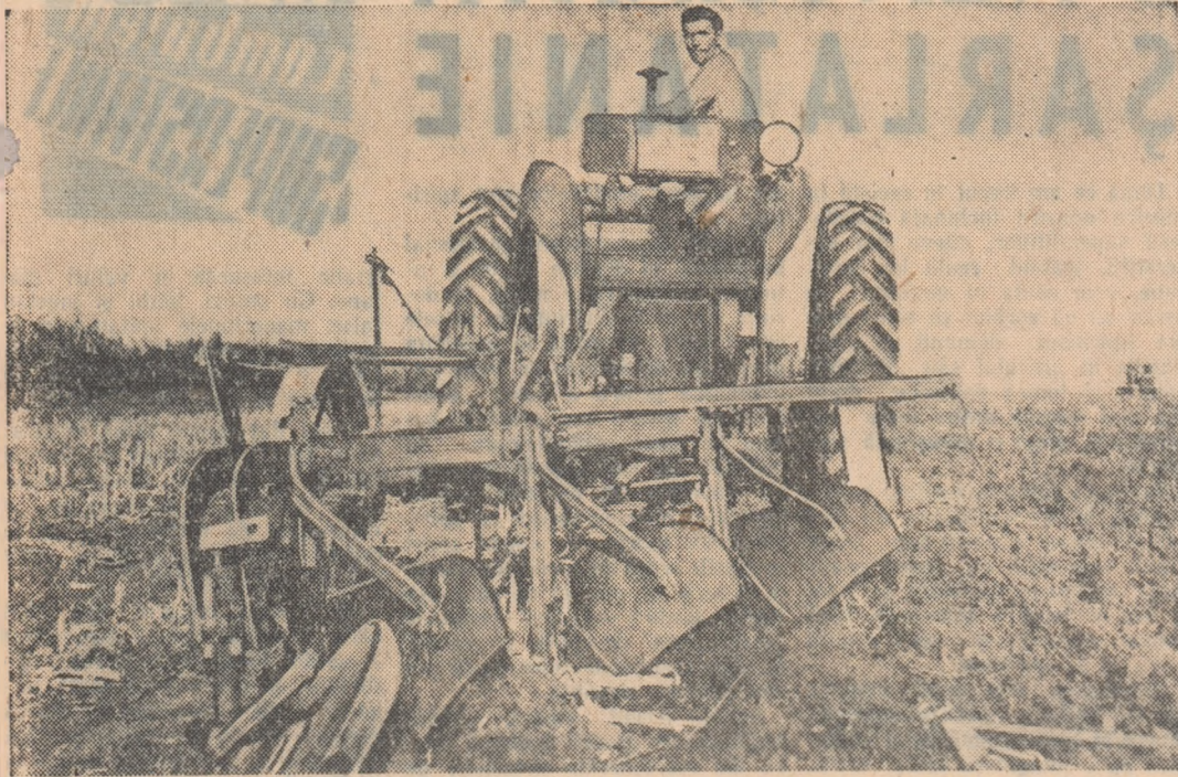
În plină campanie de arături și însămînțări, tractoriștii de la G.A.S. Gîrla Mare din raionul Cușnir, regiunea Craiova, se străduiesc să execute repede și în bune condiții aceste importante lucrări.

Nici în privința asigurării semîinței lucrurile nu stau mai bine. Organizațiile U.T.M. din comună nu întreprind mai nimic în această privință. Este necesar ca față de această situație organizațiile U.T.M. de aici să-și aducă contribuția lor concretă la îndreptarea grabnică a acestei situații.