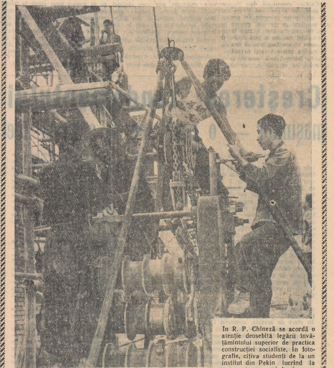
În R. P. Chineză se acordă o atenție deosebită legării învățămîntului superior de practica construcției socialiste. În fotografie, cîțiva studenți de la un institut din Pekin lucrînd la montarea unui laminor