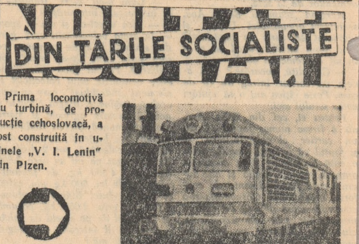
Prima locomotivă cu turbină, de producție cehoslovacă, a fost construită în uzinele „V. I. Lenin” din Pîzen.