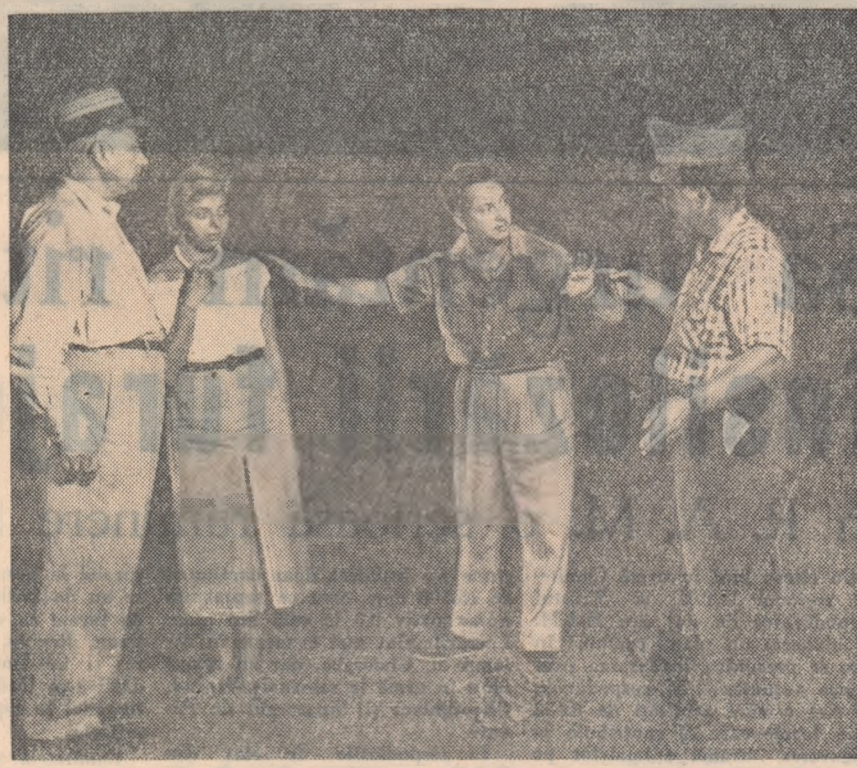
Pregătiri intense pentru deschiderea stagiunii și la teatrul din Birlad. În fotografie: Se repetă piesa „Ecaterina Teodoroiu”

Volumul de schițe și nuvele „Cumpăna inimii” de Ștefan Gheorghiu se înscrie astfel printre realizările de preț ale prozei noastre actuale. TEODOR VIRGOLICI