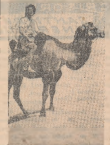
Pe cămilă, în deșert...