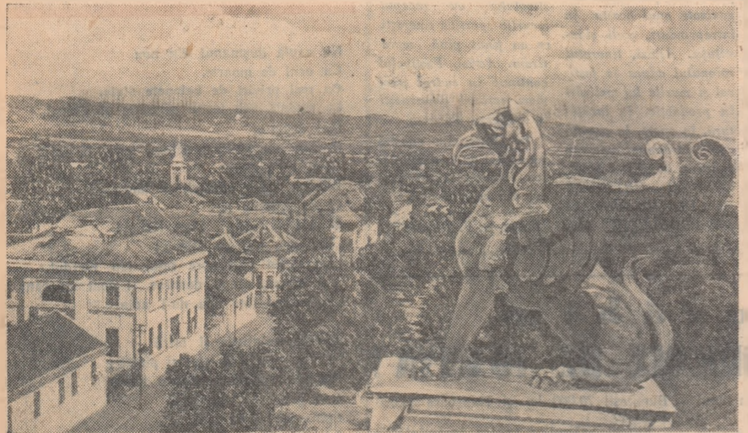
Imagine din orașul Tr. Severin

Orașului i se deschide o nouă țară. Ca urmaș al străvechilor lăcașe, Tr. Severin duce mai departe istoria veche dar își începe o istorie nouă, pornită din munca pentru construirea socialismului. Această muncă a dezvoltat larg șantierul, a ridicat în oraș noi locuințe, a construit un spital pentru copii, un sanatoriu, două cinematografe, un teatru de vară, un ștrand, un stadion cu 15.000 de locuri etc.