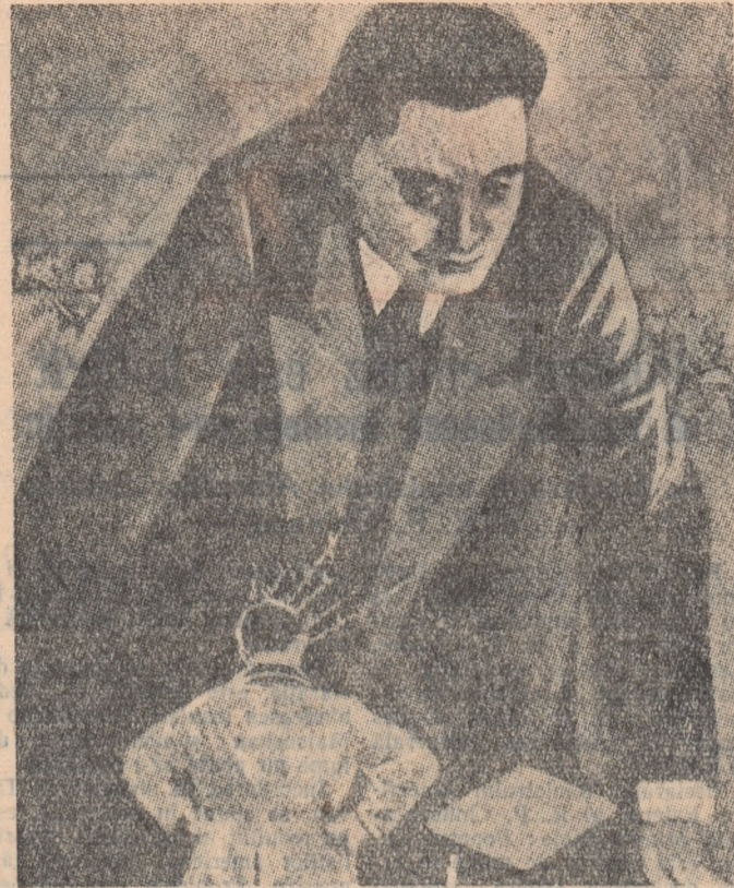
Vă este, de sigur, frică de întrebările mele, domnule prim-ministru? (Foto-montaj de John Heartfield)