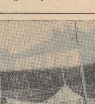
In delta Volgăi

Se știe că paralel cu oscilațiile puternice din timpul cutremurilor, scoarța pămîntului suferă în permanență oscilații slabe. Oamenii de știință le-au denumit microseisme. Mult timp s-a considerat că aceste oscilații s-ar datoră activității transporturilor din orașe, clătîrii clădirilor din cauza vînturilor puternice și altor cauze asemănătoare. Atunci cînd instrumentele au fost duse pe cîmp, ele au înregistrat și aici același microseism.