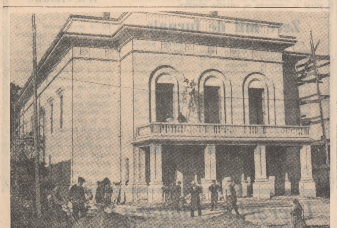
În orașul Roman se construiesc un nou cinematograful. El va avea o sală cu o capacitate de 500 locuri, prevăzută cu aer condiționat. Harnicii constructori s-au angajat să termine acest nou cinematograful cultural în cîntea zilei de 7 Noiembrie.

Reprezentanții noștri Gheorghy și Vintilescu nu s-au calificat pentru sferurile de finală ale probei de 100 m. plat realizînd timpurile de 1'11" și respectiv 1'14".