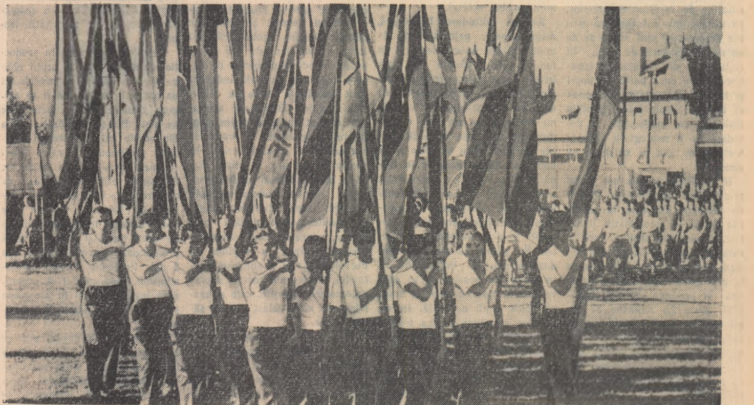
Un aspect de la deschiderea festivă