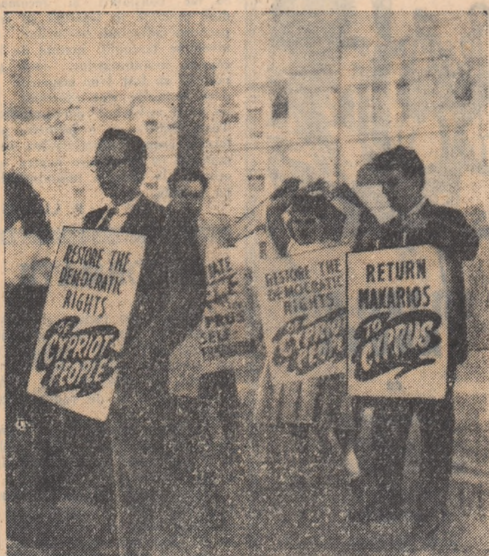
O demonstrație în Anglia prin care se cere acordarea drepturilor democratice pentru Cipru și reînțoarcerea arhiepiscopului Makarios.

NICOSIA 3 (Agerpres). — În cea de-a treia zi de intrare în vigoare a planului britanic cu privire la Cipru, au continuat în întreaga insulă acțiunile populației cipriote împotriva trupelor coloniale britanice.