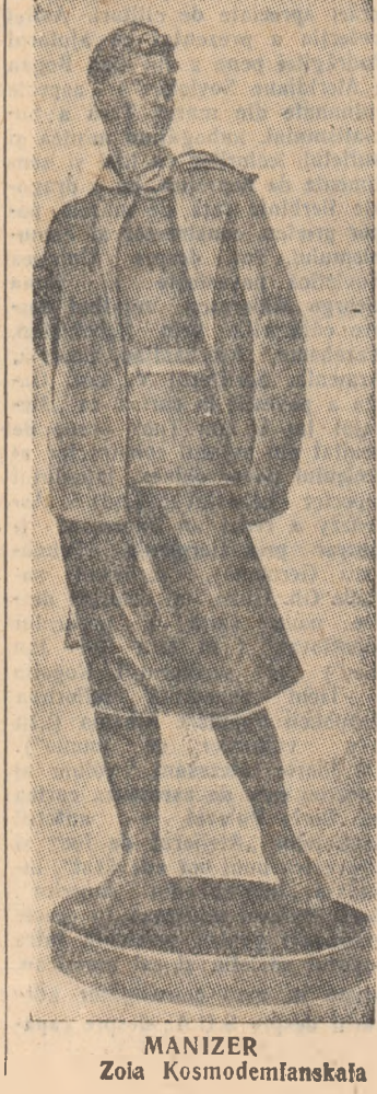
MANIZER Zola Kosmodemfanskafa

Degete de fîldeș delicate Au închis, de secole adunate Mări de iscusință și răbdare — Degete, ca fulgur de ușoare Nimenea țaria nu le o sfarmă Cînd s-au înclăștat pe-un pat de armă. Tineretului nostru.