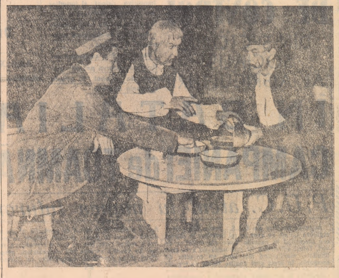
Un moment din piesa „Recolta de aur” de Aurel Baranga, prezentată pe scena Teatrului Municipal din Capitală