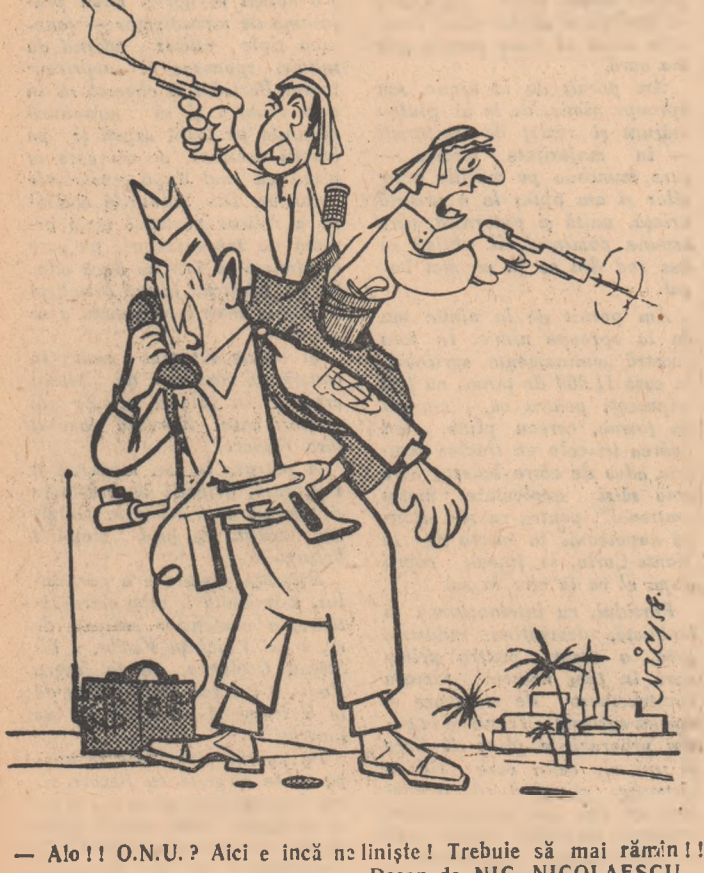
— Alo!! O.N.U.? Aici e încă nu liniște! Trebuie să mai rămân!! Desen de NIC. NICOLAESCU

Sub pretextul „neliniștii” provocate la falanștii lui Șamun, agresorii americani caută să-și amine retragerea trupelor din Liban.