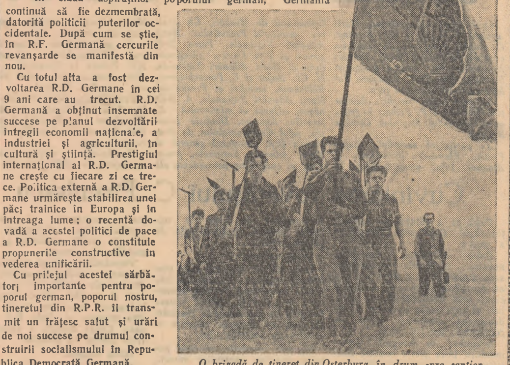
O brigadă de tineret din Osterburg în drum spre șantier.