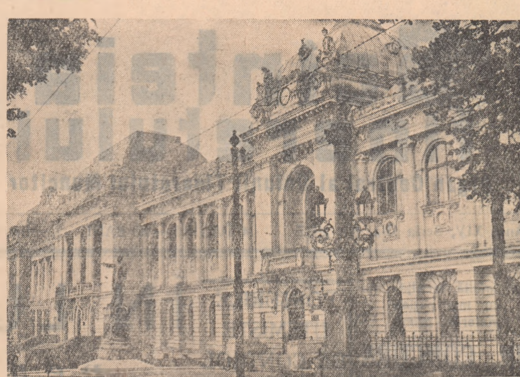
Bătrîna și mereu tînără universitate leșeană „Al. Ioan Cuza” împlinește 100 de ani. Sub cîmpoștele cărunte cresc astăzi noi generații de cărturari devotați cauzei poporului muncitor. În fotografie: un aspect al universității „Al. Ioan Cuza”