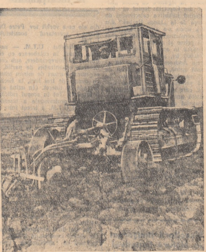
Pe cele 12.000 de hectare redade agriculturii datorită digului construit de tinerii brigadieri, tractoarele au început deja deslășirile.

— Păi, nu vezi, cum am venit aici ne-avem băgat la muncă. Pe urmă cîcă să muncim pe ploaie. Păi, ce s-chitgîșe?