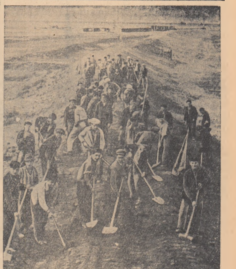
Munca avîntată și plină de entuziasm pe șantierul tineretului de la Izera. Prin digul construit pe o distanță de aproape 10 km., tinerii brigadierii din regiunea Constanța au redat agriculturii 12.000 de hectare de teren fertil. În pagina 2-a citiți reportajul „DIGUL”