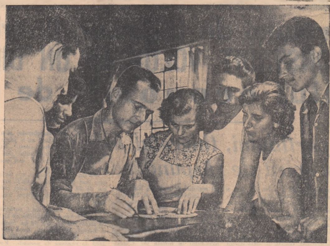
De multe ori, după orele de producție responsabilii celor două brigăzi de tineret din secția crotă a fabricii „Flacăra Roșie” discută posibilitatea plasării corecte și economice a tiparelor pe suprafața pielii.

Anul XIV, Seria II-a, Nr. 2932 4 PAGINI — 20 BANI Marți 14 Octombrie 1958