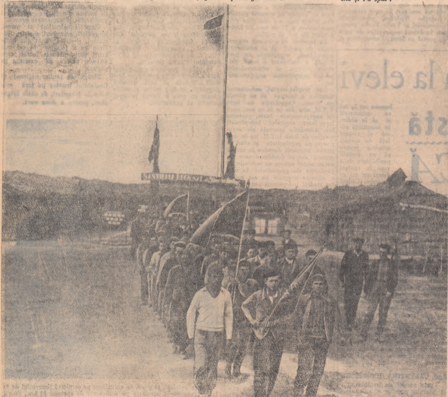
Din tabără, brigadierii pleacă la lucru, spre dig, cîntînd, înconjurîți pe brigăzi.