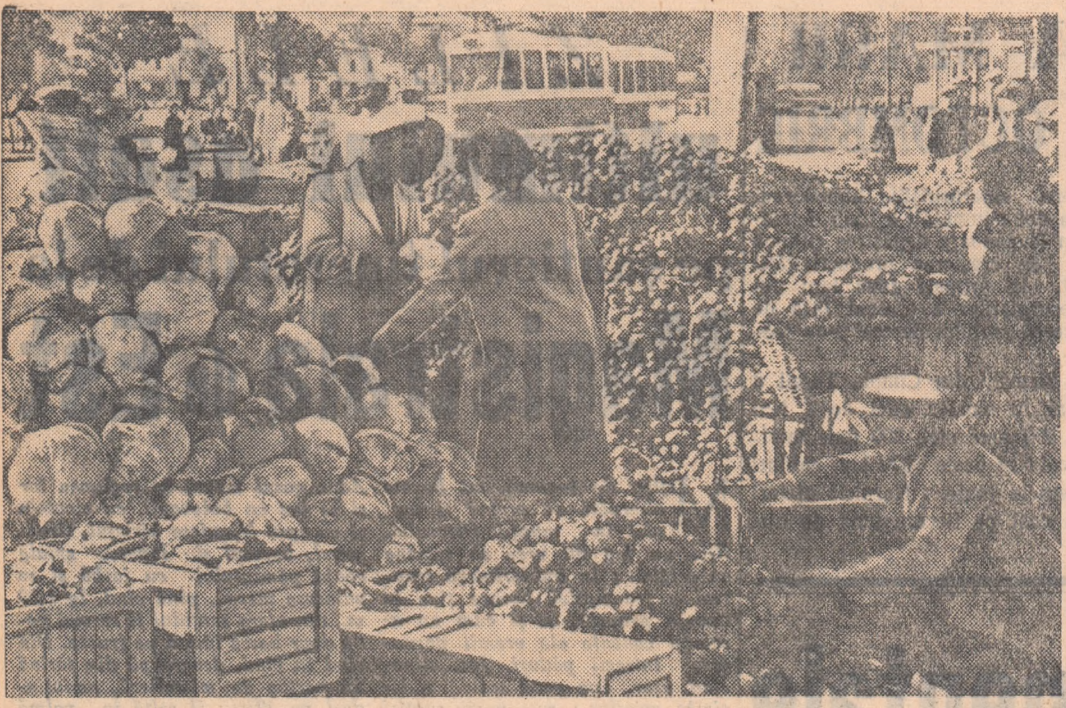
Abundența de le-gume și zarzavaturi pe piețele Capitalei. In fotografie: un aspect din Piața „28 Martie”.