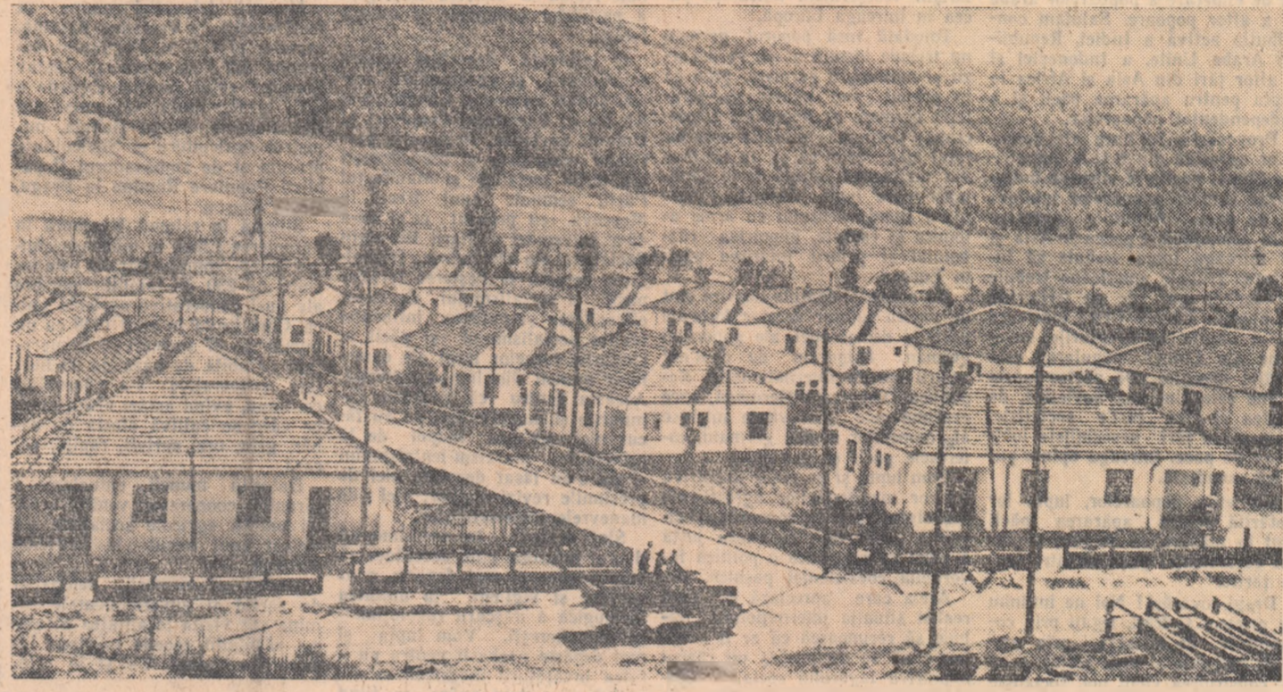
Domoalele dealuri craiovene au început să-și schimbe înfățișarea. La poalele lor au apărut ca peste noapte noile așezări ale muncitorilor petroliferi...