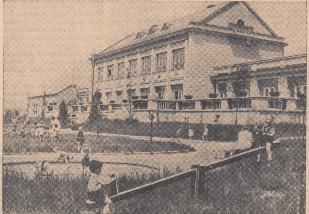
In fotografie: grădinița de copii din orașul Ostrov lângă Jáchymov.

De o parte și de alta și de-a lungul Vltave se întinde Praga. Peste apă, podurile par puncte rupte spre cetăți medievale.