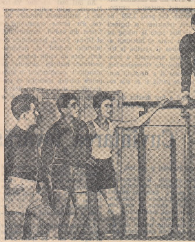
Gimnastica la aparate mărește puterea și căleşte organismul. Elevii clasei a XI-a B. de la Școala medie mixtă nr. 3 din București, după aceasta. De aceea se pregătesc intens pentru a deveni buni gimnaști.

Nu-i vorba de o prietenie oarecare ci de prietenia care s-a încheiat între membrii a două colective mari: elevii Școlii medii nr. 20 „Gh. Șincai” și muncitorii de la fabrica „Flamura Roșie”. Prietenia veche, mereu mai trainică. Între timp, elevii școlii medii i-au vizitat pe muncitorii de la fabrica „Flamura Roșie”, să citească din creațiile proprii. În sfîrșit — reuniuni tovarășești, brigăzi artistice comune, competiții sportive... B. C.