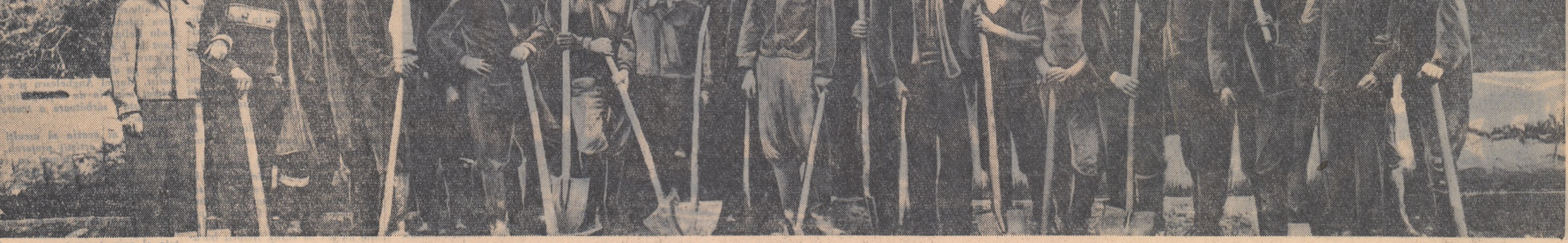
Umăr lîngă umăr, brigadierii au învins,