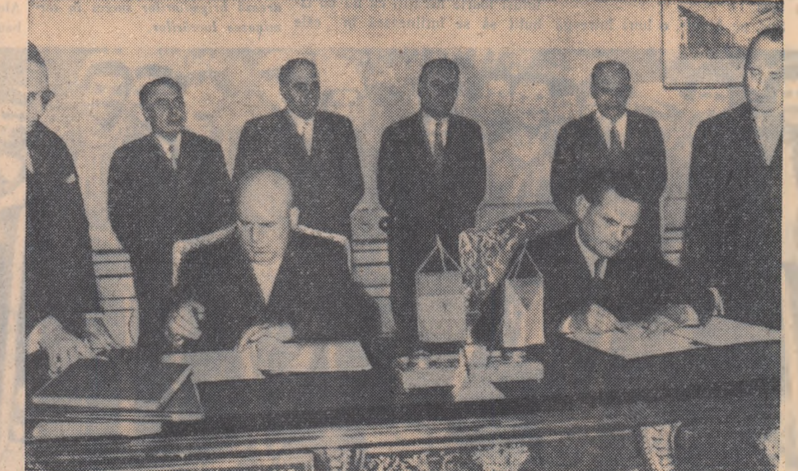
SEMNAȚIA DECLARAȚIEI COMUNE, în clișeu din stînga: tovarășii Gh. Gheorghiu-Dej și Antonin Novotny. În clișeu din dreapta: tovarășii Chivu Stoica și Viliam Siroky.