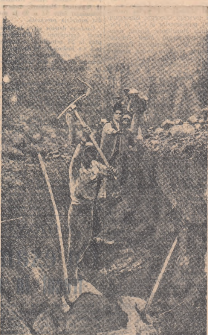
Dirzenia învinge și pinzele de apă și piatră

Text și foto: ȘTEFAN IUREȘ VICTOR CONSTANTINESCU