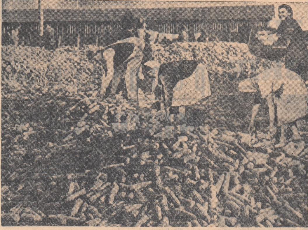
Tineri din G.A.C. Șoldanu, regiunea București, muncind la depozitarea porumbului.