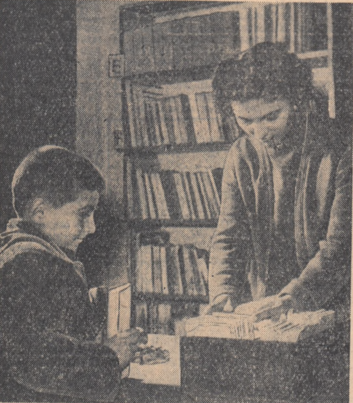
In biblioteca raională din Piatra Neamț

Desfășurarea adunărilor generale de dări de seamă și alegeri în organizațiile U.T.M. cer din partea comitetului raional o intensă muncă organizatorică și politică. Aceasta muncă a început cu mult înainte de desfășurarea adunărilor propriu zise și are ca scop îndrumarea organizațiilor de bază pe linia ridicării activității lor politice.