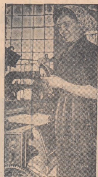
Lupta pentru sporierea randamentelor la mașini cuprinde un număr tot mai mare de muncitoare textile.

La rîndul lor pionierii au recoltat 28.000 kg. de semințe forestiere.