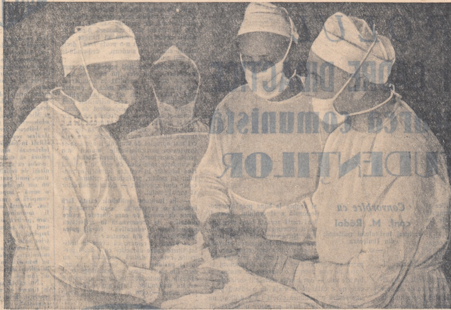
În clinica chirurgicală a Spitalului „C. Davilla”

cum eliva ani se părea încă fantastică rezolvarea unei asemenea producții în masă a unei asemenea microsirme cu o izolație de sticlă. La fabricarea microsirmei se pierde mult timp. Microsirma era trasă pînă la diametrul stabilit la cîteva mașini de tras sirmă, iar apoi era trecut printr-un cuplor special și acoperită cu materialul izolant. Nu de mult, în uzina „Microprovod” din Podolsk (U.R.S.S.) a fost pusă la punct o nouă tehnologie de producție a microsirmei. Cu ajutorul curentului de înaltă frecvență, sirma de mangan este trasă dintr-o dată pînă la dimensiunea stabilită — cu un diametru de 4 microni — și se acoperă concomitent cu izolația de sticlă. Un kilometru al unei astfel de sirme cîntărește mai puțin de un gram.