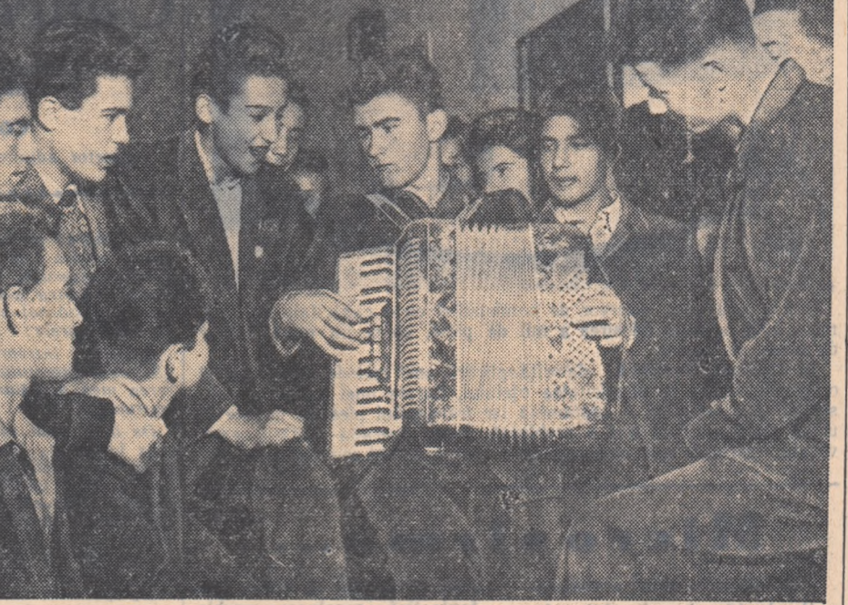
Plin de voie bună, elevii școlii de ucenici din Cluj își petrec clipe libere în sunetele plăcute ale acordeonului

În șase etape, pot participa tinerii, membri ai cooperativelor agricole de producție, întovărășiți, țărani muncitori cu gospodării individuale, precum și tinerii din G.A.S.-uri și T.-uri.