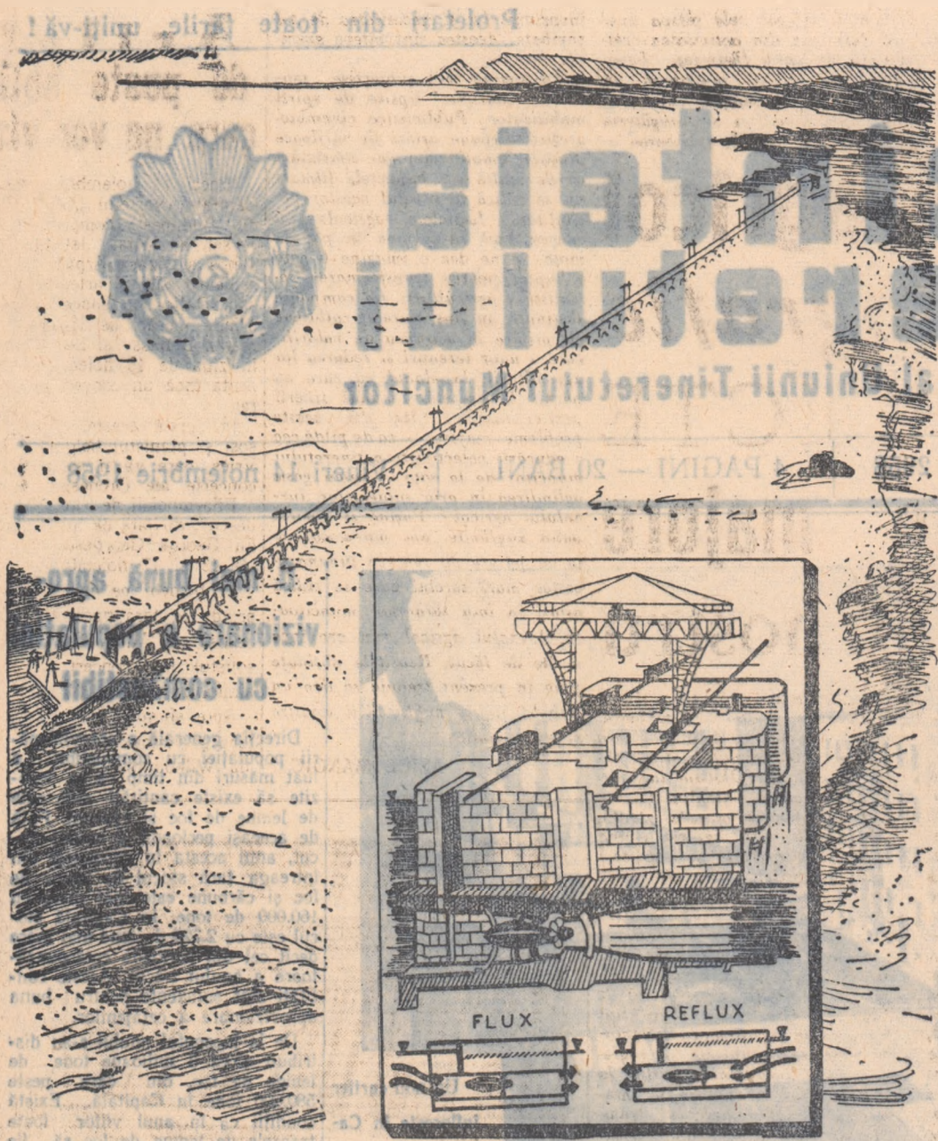
Mașina unei hidrocentrale marine