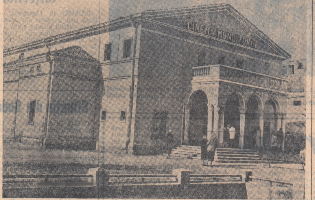
Noul cinematograful din Bacău