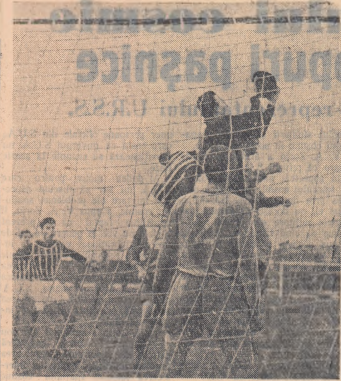
Un atac nefructificat la poarta echipei Levski Sofia

„Levski” Sofia a jucat așa cum ne așteptam: echipa bine pusă la punct la capitolul tehnic, cu o perfectă legătură între compartimente, ceea ce a ajutat de minune schimbările în uzează. Întreaga formație beneficiază de o remarcabilă condiție fizică. Trebuie să adăugăm acestor calități elementele de ordin moral, puterea de luptă, hotărîrea și dîrzenia pe care fotbalistii de la „Levski” Sofia le-au dovedit din pînă.