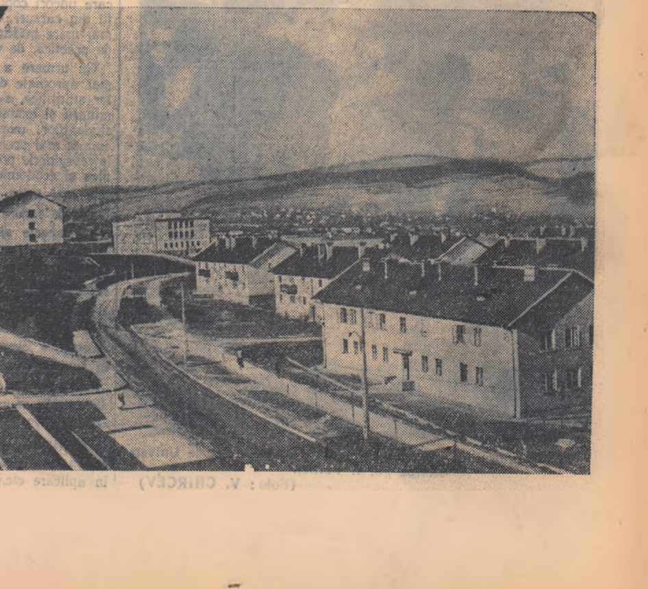
O imagine a Hunedoarei de astăzi