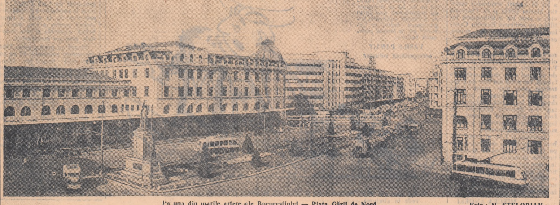
Pe una din marile artere ale Bucureștilor — Piața Gărilor de Nord