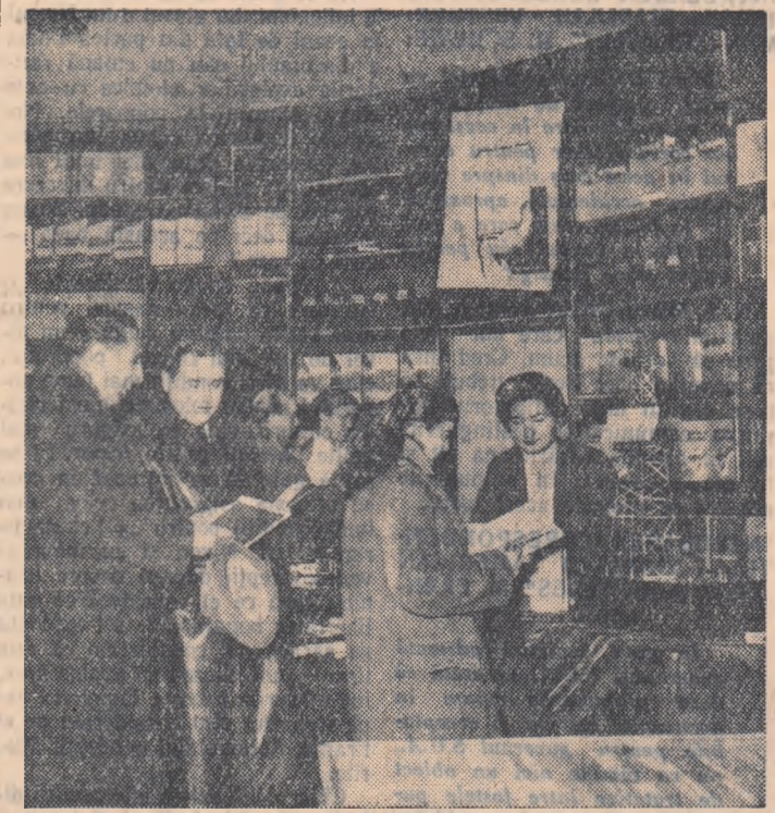
La expoziția „Cărta tehnică” de la Biblioteca Centrală din Capitală

Vineri seara, la Casa oamenilor de știință, Academia R.P. Romine a oferit un cocktail în cinstea d-lui Spiros Melas. Tot vineri seara, d-l. Spiros Melas a părăsit Capitala, îndreptându-se spre patrie.