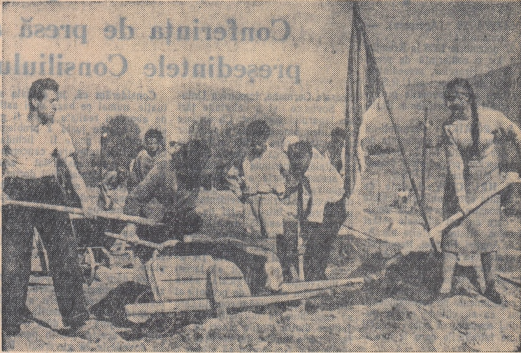
Elevi și studenți din Tirana lucrind la săperea unui lac artificial

Ziua de 29 noiembrie este pentru poporul frate albanez marea sa sărbătoare națională. Acum 14 ani poporul albanez sub conducerea partidului clasei muncitoare s-a eliberat de sub jugul ocupației fasciste și a pornit pe drumul unei vieți noi.