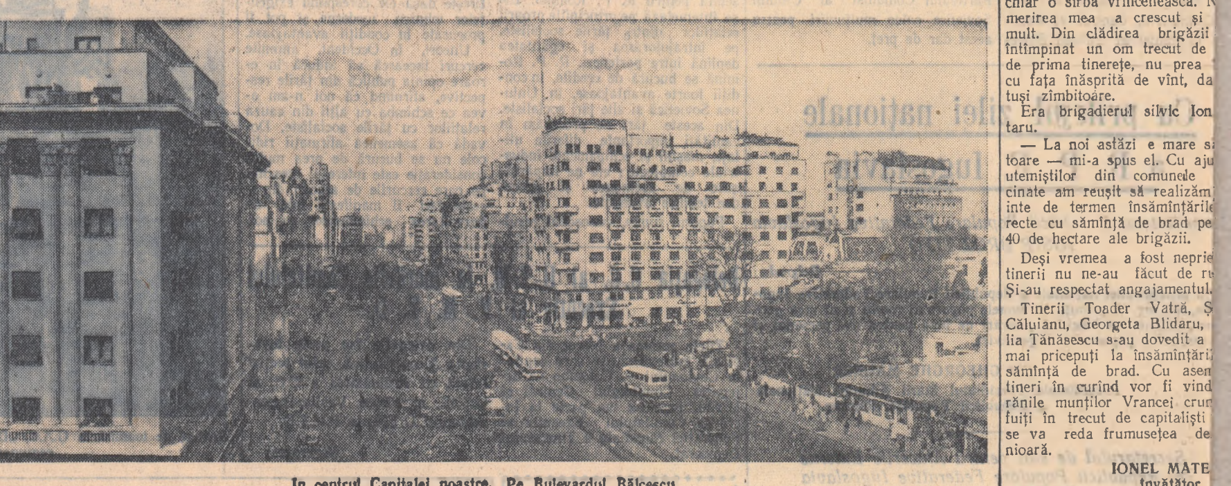
În centrul Capitalei noastre. Pe Bulevardul Bălcescu.

În pragul furtunii marea e de o linie apăsătoare. Parcă mișină natura, omul împinșat și acesei linie adîncă dar încordată, marile acțiuni, marile bătălii iar piesa „Intervenția” de scriitorul sovietic Lev Slavine e o măiestrie transparență artistică a unor astfel de momente cruciale. Concret ea e perioada de pregătire a ofensivei de la Odessa, ajunul înfrîngerii definitive a intervențiilor din sudul Rusiei. Liniștea e a bolșevicilor care, în acest răstimp, se pregătesc, chibzuiesc, se înarmează. Limbușia peșterii, amestecată cu panica, e a claselor doborîte de la putere, adunate parca într-un isteric carnaval al morții. Ca și „Tragedia optimistă”, „Intervenția” este și ea o piesă a mării, a marinarilor și a muncitorilor de pe un șantier naval. Amîndouă sînt piese de vastă frescă socială și operează cu o mulțime de eroi („Intervenția” are 50 plus figuranți). În amîndouă eroul principal sînt masele care, organizîndu-se în luptă, se individualizează cu un erou unic. Acest erou-masă e o forță care crește, se organizează și se luminează sub ochii noștri. Într-o astfel de situație piesa nu e acțiune ci de atmosferă, cu toate că desfășurarea ei nu este deloc lipsită de dinamism, de nerv. Deasupra scenei planează o atmosferă de potos și entuziasm revoluționar exprimînd hotărîrea poporului de a dărîma definitiv