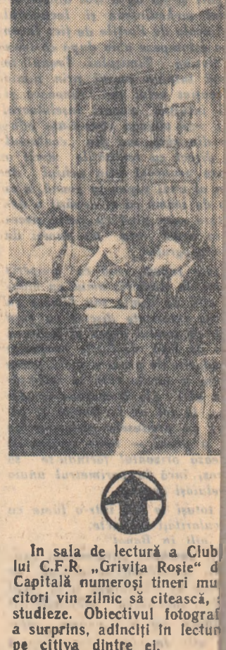
În sala de lectură a Clubului C.F.R. „Grivița Tineri“ din Capitală numeroși tineri muncitori vin zilnic să citească, să studieze. Obiectivul fotografiei surprinde, adnciți în lectură pe cîțiva dintre ei.