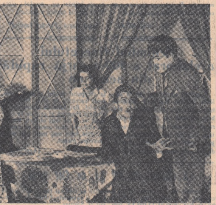
La Casa de cultură a studenților „Grigore Preoteasa“ activitatea cercului de teatru este deosebit de bogată. Fotoreporterul a surprins un aspect al muncii colectivului studențesc de la Institutul de petrol, gaze și geologie care pregătește unul din spectacolele cu piesa „Ion Anapoda“ de G. M. Zamfirescu.

De multe ori organizațiile utemiste din întreprinderi și școli ne solicită ajutor în organizarea activității artistice. Numeroși actori ai teatrului au fost repartizați ca instructori pe lingă întreprinderi și școli. În acest scop instituțiile superioare de învățămînt permanentă care trebuie să stea în atenția tuturor organizațiilor de bază U.T.M., cit și a comitetelor orașenească și raional U.T.M. Muscel, care trebuie să desfășoare o muncă intensă de îndrumare și control în această direcție.