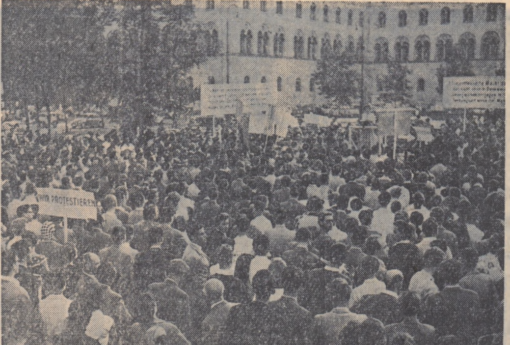
In Germania occidentală se aud tot mai multe glasuri lucide asupra pericolului reînarmării atomice. Într-o fotografie noastră dintr-un miting al studenților din München organizat împotriva reînarmării atomice a Bundeswehrului.