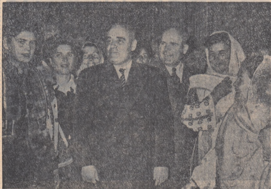
Tovarășii Gh. Gheorghiu-Dej și Chivu Stoica în mijlocul unui grup de delegați la Congres