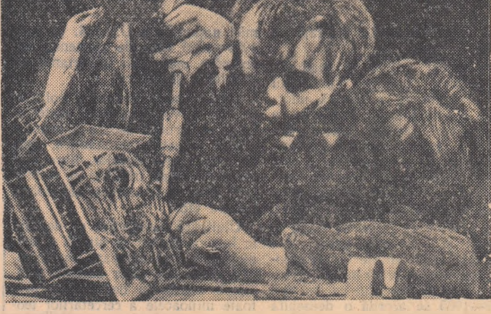
În cercurile profesionale, tinerii cetățeni ai R.P. Ungare își însușesc deprinderi practice. În fotografie: cîțiva pionieri din Budapesta construind un aparat de radio

La 10 decembrie 1958 se împlinesc zece ani de când Adunarea Generală a Organizației Națiunilor Unite a adoptat un important document internațional — Declarația universală a drepturilor omului.