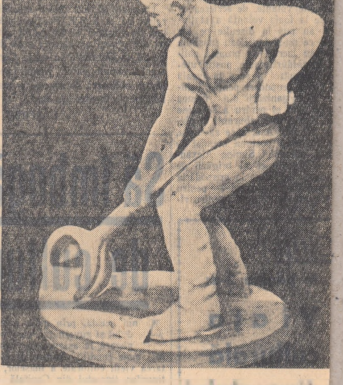
De curind a avut loc la Casa prieteniei romino-sovietice Capitala venisajul primei expoziții biennale de artiștii plastici matori din țara noastră... (text continues)

La treisprezece decembrie, în Piața Teatrului, Muncitorii pașnici victime-au căzut. Dar unde merg oare atenția muncitorilor? Ei manifestează pentru cauza lor... (text continues)