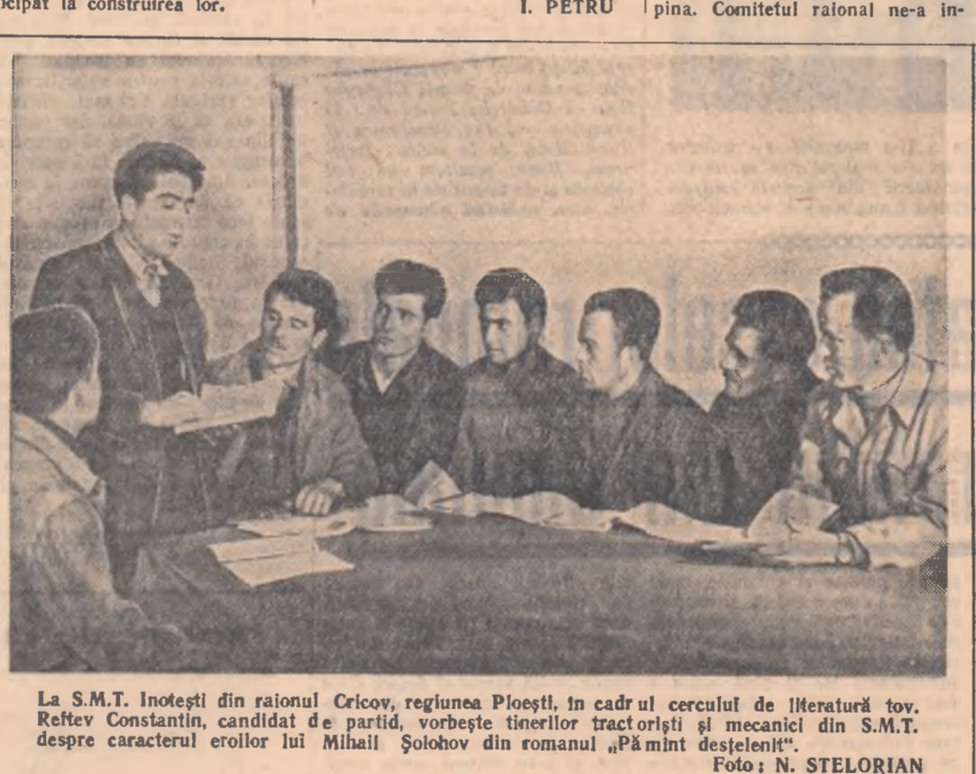
La S.M.T. Intelecti din raionul Cricov, regiunea Ploesti... (text continues)

Apoi te repeși. Strofa următoare spune, de fapt, cam același lucru... (text continues)