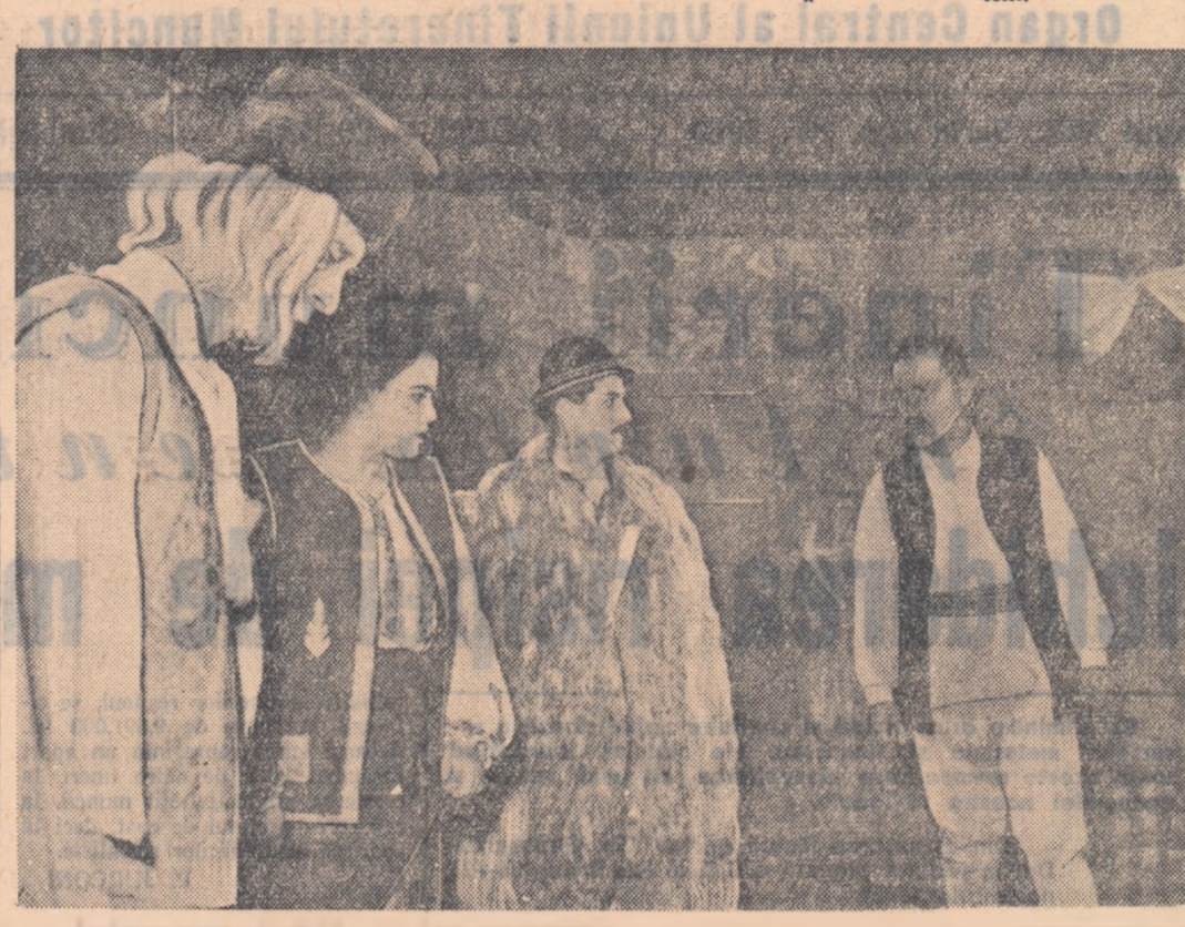
Rodnica activitate a unei brigazi artistice de agitatie

antrenati la activitatea culturala... (text continues)