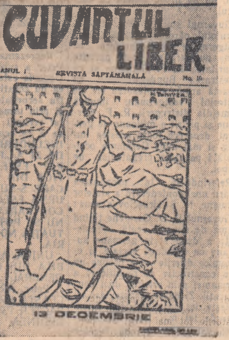
Desen de N. Tonitza publicat în revista „Cuvântul liber”

Tradiția luptei poporului nostru împotriva asupririi capitaliste constituie o piadă veche de patriotism pentru țara noastră.