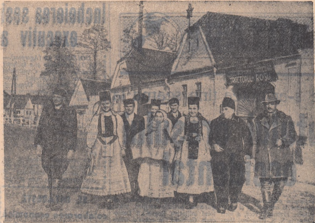
Un grup de colectivști din comuna Cristian, raionul Sibiu, în pitești costume populare germane