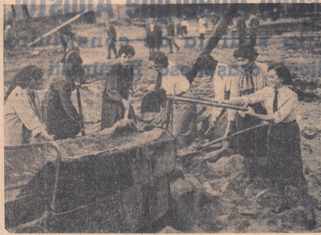
Întâi o imagine a unui aspect din activitatea Uniunii Tineretului Socialist din R.P. Polonă: participarea la munca voluntară pentru construirea unei străzi în Varșovia.

În încheierea comunicatului se arată: „În cursul tratativelor, participanții la conferință și-au expus pozițiile și au avut un schimb de păreri asupra problemelor examinate. Conferința a fost utilă, deoarece a permis clarificarea punctelor de vedere ale părților. Participanții la conferință au căzut de acord să întrerupă ședința cu prilejul vacanței de Crăciun și Anul Nou, precum și pentru a raporta guvernelor despre lucrările conferinței. Participanții la conferință își exprimă speranța că