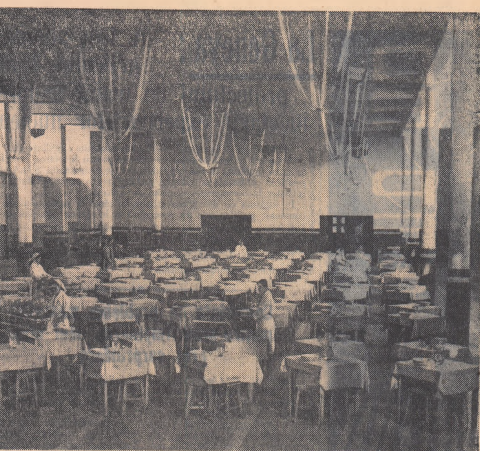
Sala de mese a cantinei uzinelor „23 August” din Capitală

Încheiere, tovarășul Gheorghe Apostol a spus: „Sub conducerea partidului, lupțind cu hotărâre pentru realizarea politicii sale, sindicatele vor ridica activitatea lor pe o treaptă superioară, aducând o contribuție tot mai mare la lupta întregului popor pentru dezvoltarea economiei noastre naționale și ridicarea nivelului de trai, material și cultural, al celor ce muncesc în Republica Populară Română”.