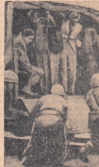
În Argentina au avut loc manifestările studențesci împotriva încercărilor cercurilor reacționare a a schimba caracterul laic al învățămîntului. După cum se vede în fotografia noastră poliția a intervenit operînd numeroase arestări.

In Argentina au avut loc manifestările studențesci împotriva încercărilor cercurilor reacționare a a schimba caracterul laic al învățămîntului. După cum se vede în fotografia noastră poliția a intervenit operînd numeroase arestări.