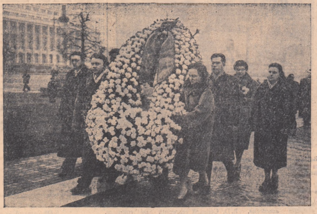
Spre Monumentul Eroilor Sovietici

Citeam articolele din „Știința tineretului” apărute în rubrica „Tinerete — educație — răspundere” în care se vorbea despre comportarea nedemnă a unor tineri actori. Ce urit! — mi-am spus, parcurînd rîndurile scrise, pe bună dreptate, cu indignare. Aceasta a fost prima reacție. Am reluat apoi aceste fapte și le-am judecat cu luciditatea dascălului cărui fi sunt încredințat, spre formarea viitorilor actori, cu severitatea tovarășului mai în vîrstă, care nu poate admite ca titlul celui poartă de actor, să fie înfățișat, pătat. Mi-am dat seama că am fost blînd la început. Faptele relatate în cele două articole sînt mult prea grave ca să pot spune simplu: ce urit! Împotriva lor trebuie să ne ridicăm cu toată tăria, dar nu fără a căuta rădăcinile profunde, cauzele ce au generat aceste fapte, fără a încerca să aflăm cum au ajuns acești tineri să nesocotească tot ce are frumos, demn, moral, noua etică a actorului din patria noastră.