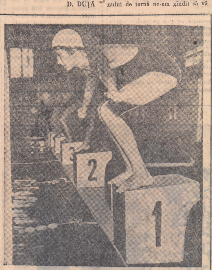
Bazinul acoperit Floreasca a găzduit duminică o interesantă întrecere studențească. Vă prezentăm startul din proba de 100 m. braze femel.