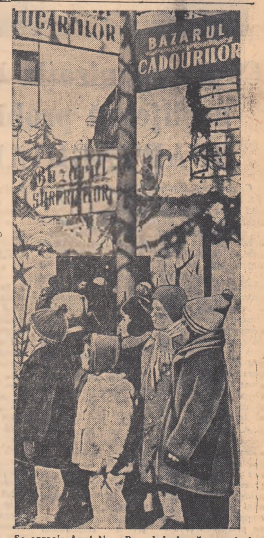
Se apropie Anul Nou, Pomul de Iarnă, surprizele și bucuriile pentru mari și — în special — pentru cei mici. Principalele străzi ale Bucureștilor, feeric luminate, au căpătat un aspect sărbătoresc. Cu născururile lipite de vitrinele magazinelor, copiii își aleg jucăria preferată pe care — prin nu se știe ce întimplare — o va aduce în dar Moș Gerilă.