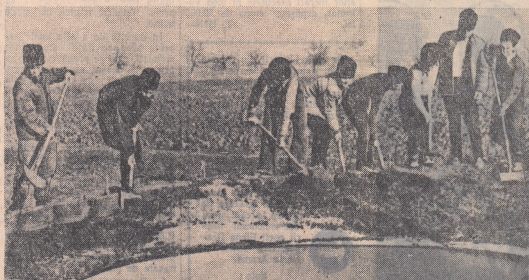
Aici vor fi irigate încă 30 de hectare de porumb. Echipa tineretului de la G.A.C. „Ștefan Gheorghiu” din comuna Izbiceni, raionul Corabia a început lucrările de săpare a canalelor de irigație.