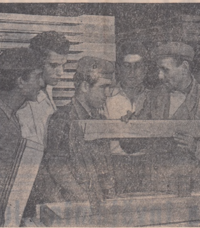
Brigada a III-a de tineret a fabricii de mobilă I.P.R.O.F.I.L. din București, este o brigadă în untașă pe întreprindere. Iată în fotografie, discutînd despre calitatea produselor.