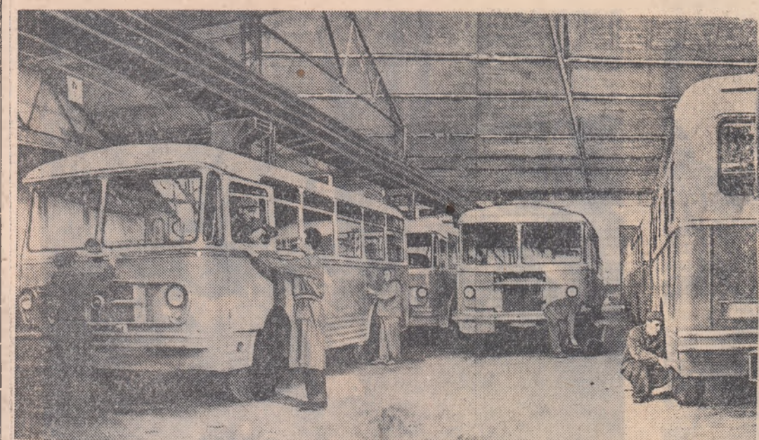
În hala de montaj a uzinelor „Tudor Vladimirescu” din Capitală se face un ultim control la un nou lot de autobuse gata pentru a fi expediate