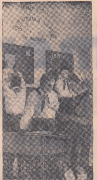
Elevii Școlii medii nr. 3 din Capitală pregătesc numărul festiv al gazetei de perete dedicat Centenarului Unirii.