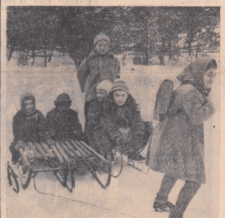
A venit iarna. Bucuria celor mici e pe deplin justificată. Sîniștele erau de mult pregătite.

vor crește în anul acesta 40.000 de păsări. Zilele acestea, în organizațiile de bază U.T.M. din unitățile amintite se stabilesc măsurile necesare pentru desfășurarea în bune condiții a acțiunii de creștere a păsărilor.