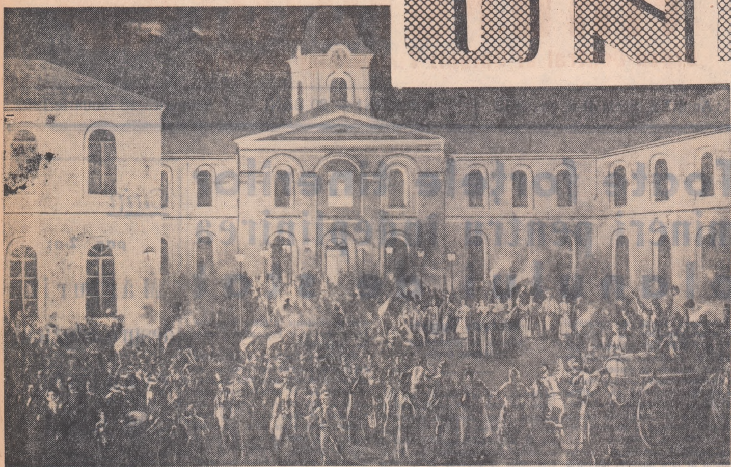
Celebrul tablou al lui Theodor Aman, înfățișând Hora Unirii la Craiova

Istoriografia burgheză a încercat nu odată să deformeze faptele și să falsifice istoria în legătură cu înfăptuirea Unirii.