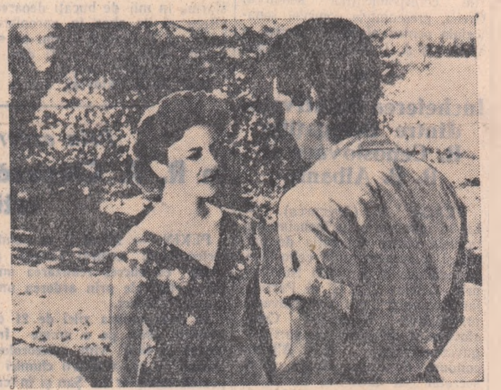
O scenă din film