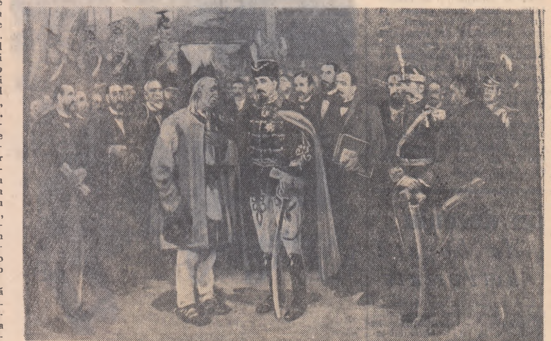
Un tablou din expoziție ce este organizată la Muzeul Central Militar în Cuza Vodă și moș Ion Roată

Ideea sau mai precis conștiința unității naționale a poporului român, pre-simțită vag în operele cronicarilor, apare formulată ca o revendicare îndată lui „Oltul”, „România”, „România literară”, „România”, „Școlul”, „Steagul Dunării”, „Timpul”, „Zimbud”, „Zimbru și Vulturul”, colaborează și mai de seamă scriitorii ai vremii ca Vasile