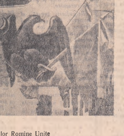
Drapelul țărilor Romine Unite

Așa și tu vei crește, cu timpul, o unire! Pieri vor și tiranii și robii demni de ei, Unire! se vor stinge ca niște nori de vînt Ce-neonjură de umbră lumina unei stele.